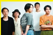
Mahina Apple Band