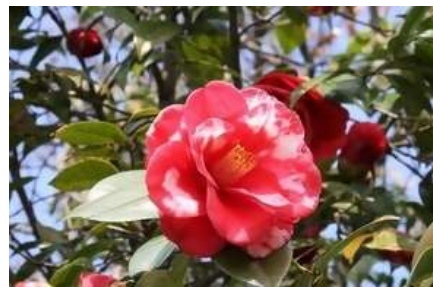
ツバキ類 低木、中木

市の花のクルメツツジは、種類が多く4月頃に葉は見えなくなるくらいたくさんの花をつけます。夏場の水やりは忘れずに。