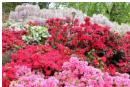
クルメツツジ 低木

市の花のクルメツツジは、種類が多く4月頃に葉は見えなくなるくらいたくさんの花をつけます。夏場の水やりは忘れずに。