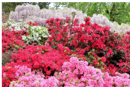
クルメツツジ 低木

市の花のクルメツツジは、種類が多く4月頃に葉は見えなくなるくらいたくさんの花をつけます。夏場の水やりは忘れずに。