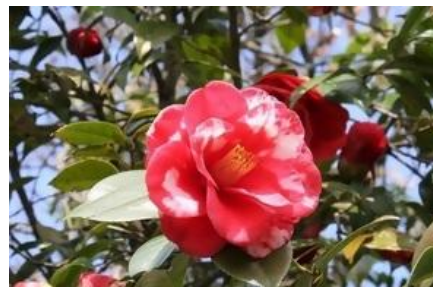
ツバキ類 低木、中木

市の花のクルメツツジは、種類が多く4月頃に葉は見えなくなるくらいたくさんの花をつけます。夏場の水やりは忘れずに。