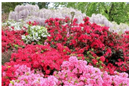
クルメツツジ 低木

市の花のクルメツツジは、種類が多く4月頃に葉は見えなくなるくらいたくさんの花をつけます。夏場の水やりは忘れずに。