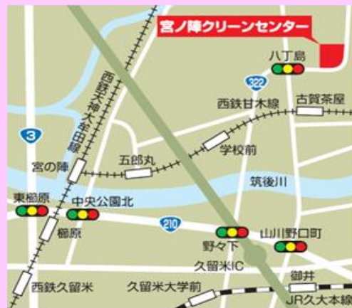
《宮ノ陣クリーンセンター周辺図》

久留米市環境部環境政策課 TEL:0942-30-9146 FAX:0942-30-9715 MAIL:kansei@city.kurume.fukuoka.jp