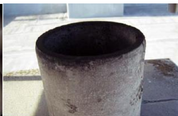
煙突の内側に使用 石綿含有断熱材