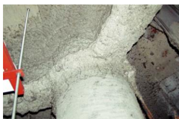
柱や梁に施工 吹付け石綿