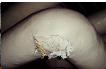
エルボ部に使用 石綿含有保温材