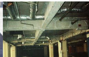
鉄骨を被覆して保護 石綿含有耐火被覆材