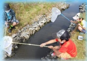
なにが捕まるかな♪