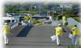
地域環境美化 「クリーンパートナー活動」

ダイハツ工業(株)では、“地域に光を当て、人の心を軽くする”という想いのもと、環境に優しいクルマづくりだけでなく、地域社会との連携・協力や啓発活動を通して、「生物多様性」を守る活動を行っています。九州開発センターでも生きものの生息調査、希少種の保全、外来種の防除、地域環境美化等の活動を行っています。