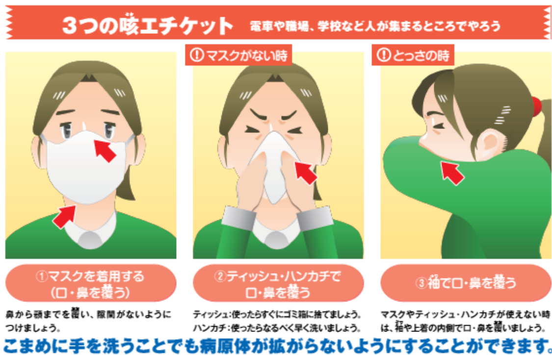
図3 咳エチケットについて