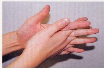
4. 指の間を十分に洗う