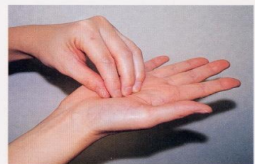
3. 指先、爪の間をよく洗う