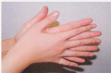
1. 手のひらを合わせ、よく洗う