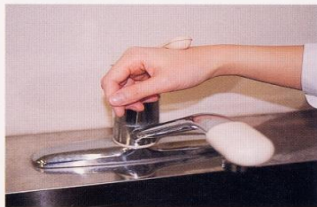
7. 水道の栓を止めるときは、手首か肘で止める。できないときは、ペーパータオルを使用して止める