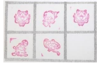
活動が終わるごとにスタンプを押す台紙