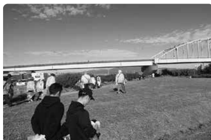
筑後川がきれいになっていきます。