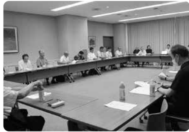
久留米市ふれあい都市推進協議会 定期総会