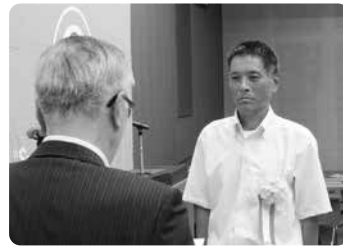
「小さな親切」運動実践校 優秀校表彰 久留米市立荒木小学校様

これらの継続した取り組みが「小さな親切」運動の趣旨に沿っていると認められました。