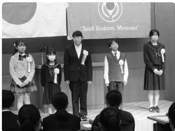
作文コンクール全国大会入選の皆さん