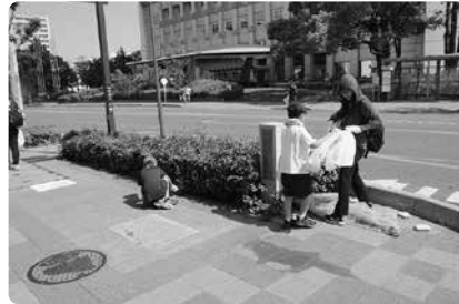
親子で街をきれいに...頑張ってます！