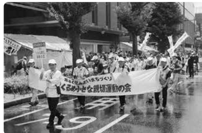
パレードに出発です。