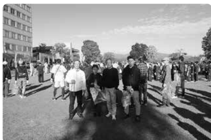
みなさんお疲れ様でした！