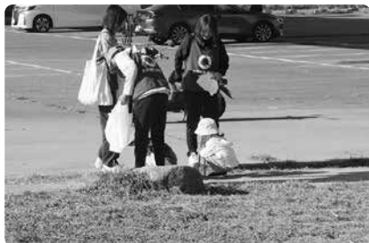
小さなお子さんも頑張ってます。

国土交通省ならびに久留米市の主催で、当運動の会からは17団体191名の皆様に参加頂きました。