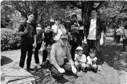
街がきれいになりました！