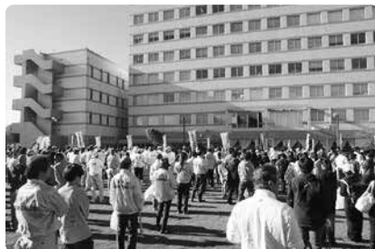
たくさんの方が集まりました。