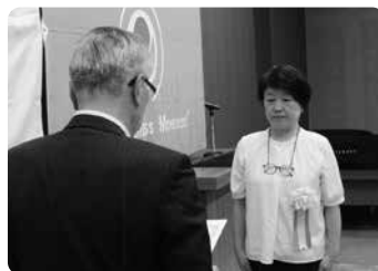
「小さな親切」運動実践校 優秀校表彰 久留米信愛中学校様