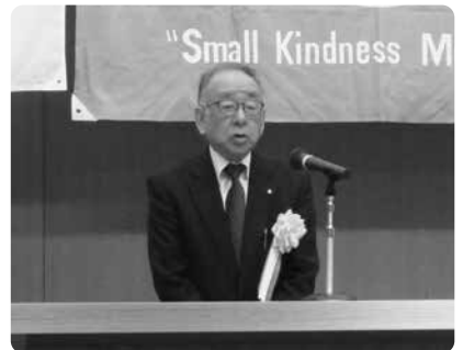
来賓挨拶 橋本政孝 久留米市副市長