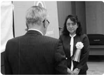
「小さな親切」運動実践校 優秀校表彰 久留米市立川合小学校様

こうした年間を通じた活動が「小さな親切」運動の趣旨に合致するものと認められました。