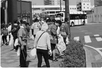
植え込みの中にもゴミがあります！

久留米市ふれあい都市推進協議会の主催で、当運動の会からは30団体212名の皆様に参加いただきました。