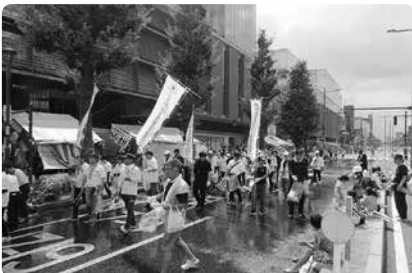
みんなで久留米のまちをきれいにしよう！