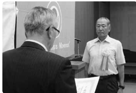
「小さな親切」実行章の贈呈 久留米山岳会様

久留米山岳会は、九十四年の歴史を有し県内でも八幡山岳会に次ぐ二番目に古い伝統のある山岳会です。久留米山岳会では、登山の技能を活かし機械では対応が難しい篠山城址の石垣の清掃活動を春と秋に実施しています。久留米山岳会の活動は、城跡の歴史遺産の保存と景観美化に大きく貢献されています。