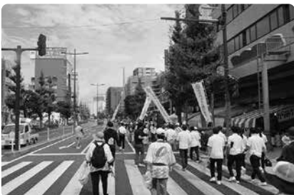
暑い中ご苦労様です。