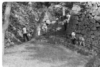
皆さん頑張ってください。