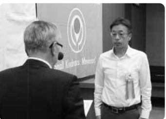
「小さな親切」運動実践校 優秀校表彰 久留米市立田主丸中学校様