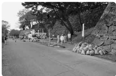
たくさんの落葉が集まりました。

九州電力送配電株式会社久留米配電事業所様ならびに関連企業の皆様が、長年に亘り取り組んである篠山城址の清掃活動に当運動の会も参加致しています。当日は21名の会員の方に参加いただきました。