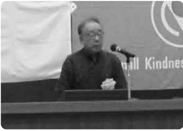
来賓挨拶 橋本政孝 久留米市副市長