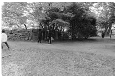
境内もきれいになりました。