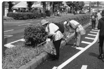
こんなところにもゴミが落ちています。