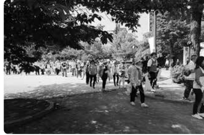
みなさんががんばりましょう！