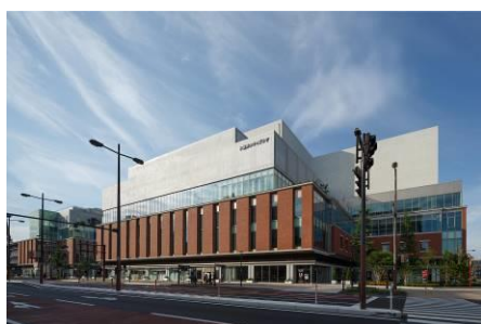
▲久留米シティプラザ

九州の東西南北どこにでもアクセスしやすいという利便性を持った、これらの広域交通ネットワークを維持・発展させていくことで、地域全体の更なる発展につなげます。