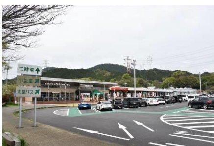
▲基山パーキングエリア