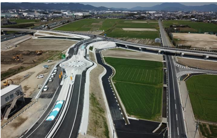
◀ 小郡鳥栖南スマートインターチェンジ

筑後川に育まれた豊かな土壌と豊富な水資源を有するクロスロード地域は、古くから農業をはじめ多様な産業の集積といった面で発展してきました。平野部が多いことから開発しやすい地域形態であるとともに、歴史ある寺社仏閣や多彩な文化施設、豊かな食文化など様々な地域資源が存在します。