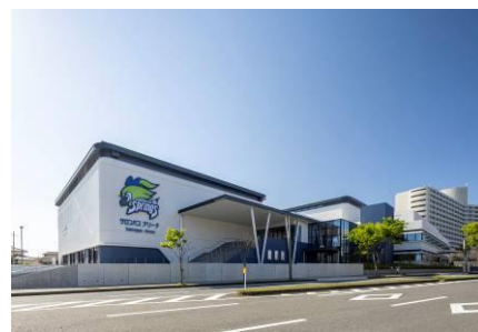
▲サロンパスアリーナ