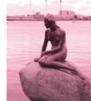
人魚姫(デンマーク)