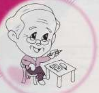
図書情報ステーション

男女平等推進センターは、男女平等な社会の実現をめざして、皆さんとともに行動するセンターです。