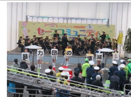
セーフコミュニティフェスタ