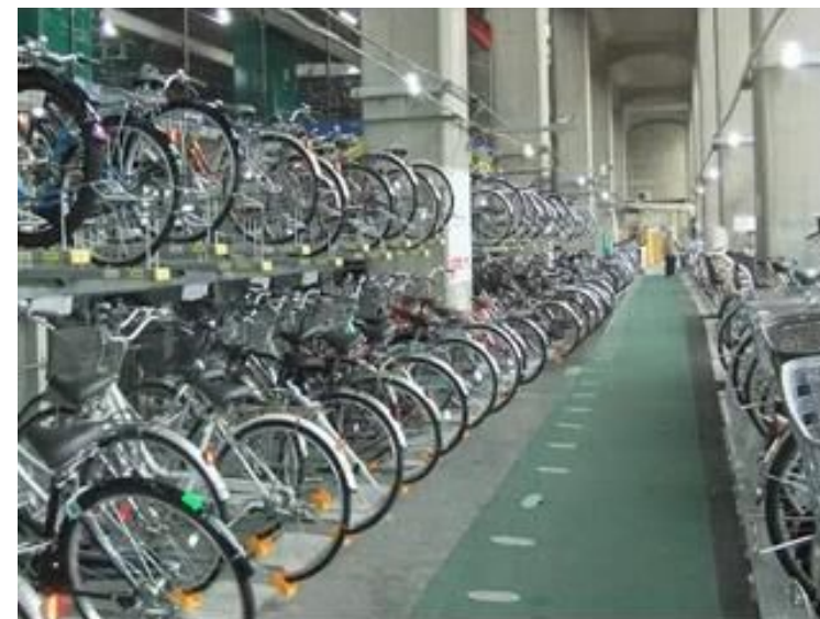
西鉄久留米駅高架下駐輪場整備イメージ