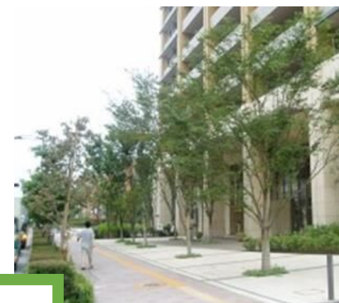
民有地緑化のイメージパース