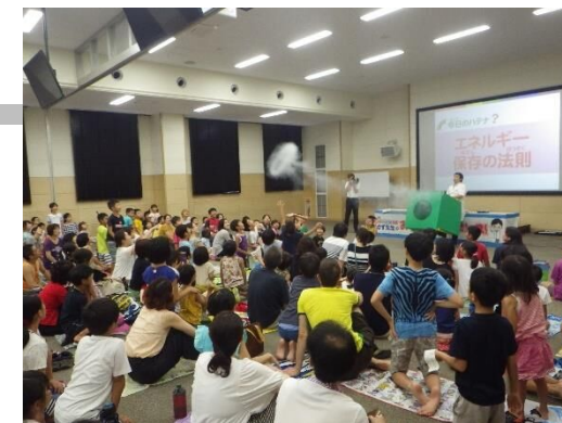
環境交流プラザ事業 (こどもなつやすみ教室)