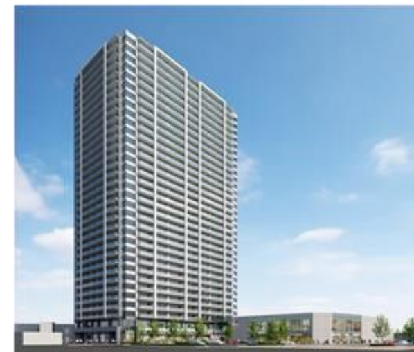
JR久留米駅前第二街区のイメージパース