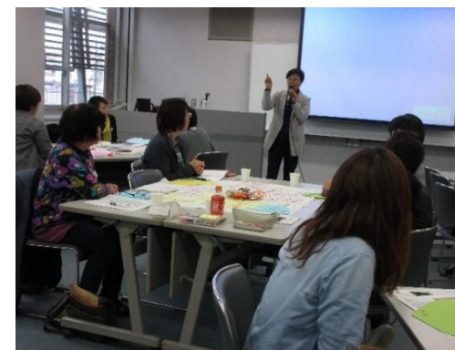
女性のまちづくり参画講座