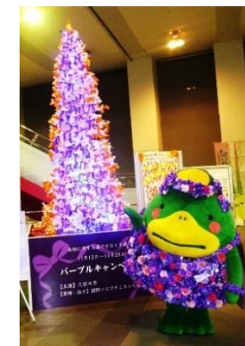
女性に対する 暴力をなくす運動 (パープルツリー)