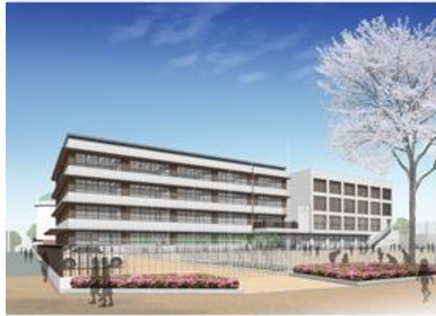
京町小学校外観イメージパース