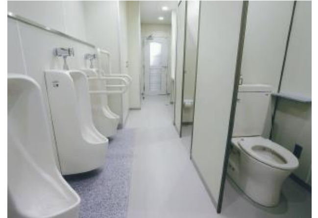
衛生的で利用しやすいトイレへ改修