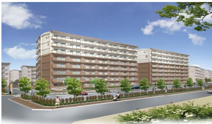
大善寺団地No.7・8棟完成イメージ