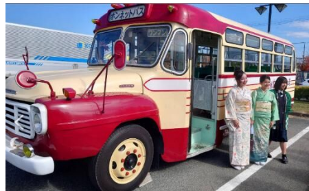
ウグアイからの観光客

道の駅くるめから、29日は徒歩、30日はバスで来た来場者が多かった。 チラシの抽選券で、来場者に 来場ルートを確認 できた。 道の駅には、事前PRの際にも協力してもらった。