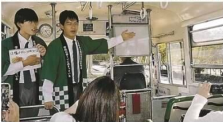
⑤紅葉した柳坂曾根の櫛並木 (2024年撮影) ⑥実際のコースで、ガイドの予行演習をする久留米筑水高の生徒

筑後川流域に残るハゼの歴史や魅力を紹介する特別展「筑後川遺産櫛の道特別展」が29、30日、久留米市山本町の「柳坂曾根の櫛並木」沿いの特設会場で開かれる。「櫛の道」が今年5月、筑後川に育まれた文化財を歴史的なストーリーで結びつけ保存活用を図る市の「筑後川遺産」に登録されたのを記念し、地元住民らでつくる「筑後川櫛のあかりを灯す会」が初めて企画した。