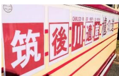
←バス側面に屋外広告