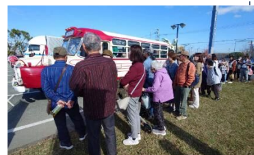
道の駅くるめ バスを待つ行列

参考) 本部売店での売上 ハゼまつり期間(11/22~28) 18,242 円/日