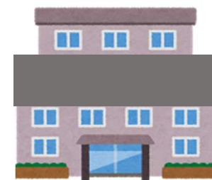
校区コミュニティセンター