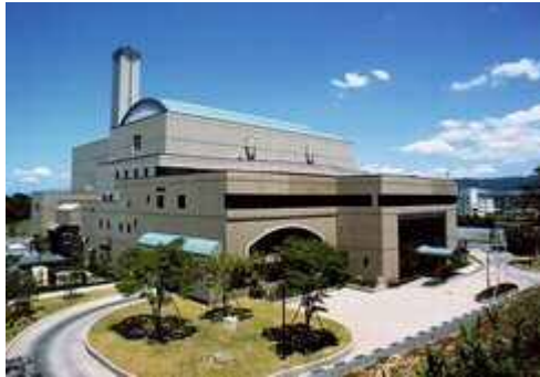
上津クリーンセンター