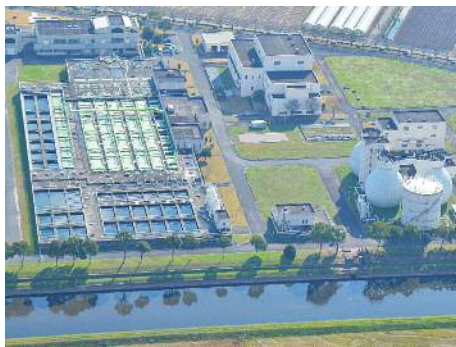
南部浄化センター