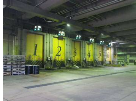
上津クリーンセンター 【焼却炉】