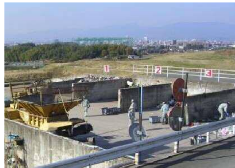
高良内中継基地 (旧高良内埋立地)