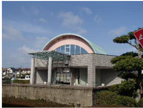
千歳市民センター