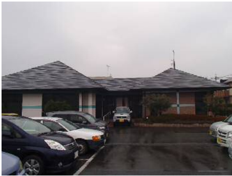
高良内文化財収蔵庫