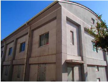
西部水防備蓄倉庫