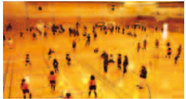
小学生によるソフトバレーボールの試合（西部地区体育館）

本市では、全国平均に達していない種目を重点にした体育授業の充実や運動会や体育祭の見直しなど、体力向上に継続的に取り組んでいる。今後は、学校での取り組みに加え、地域と連携した学校施設等の積極的な活用についても検討していきたい。