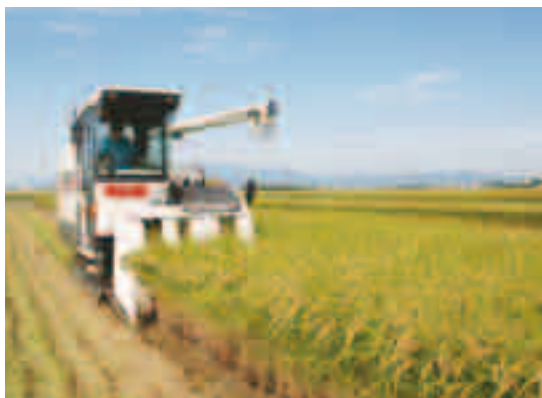
本市農業の中核を担う米づくり（北野町）