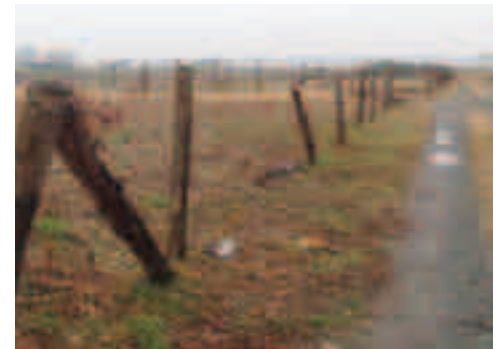
現在活用がなされていない市有地（三猪町）