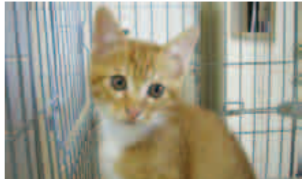
動物管理センターに持ち込まれた子猫

猫の殺処分を減らすには、飼い主のいない猫に不妊去勢手術を施し、猫の個体数を抑制する必要がある。