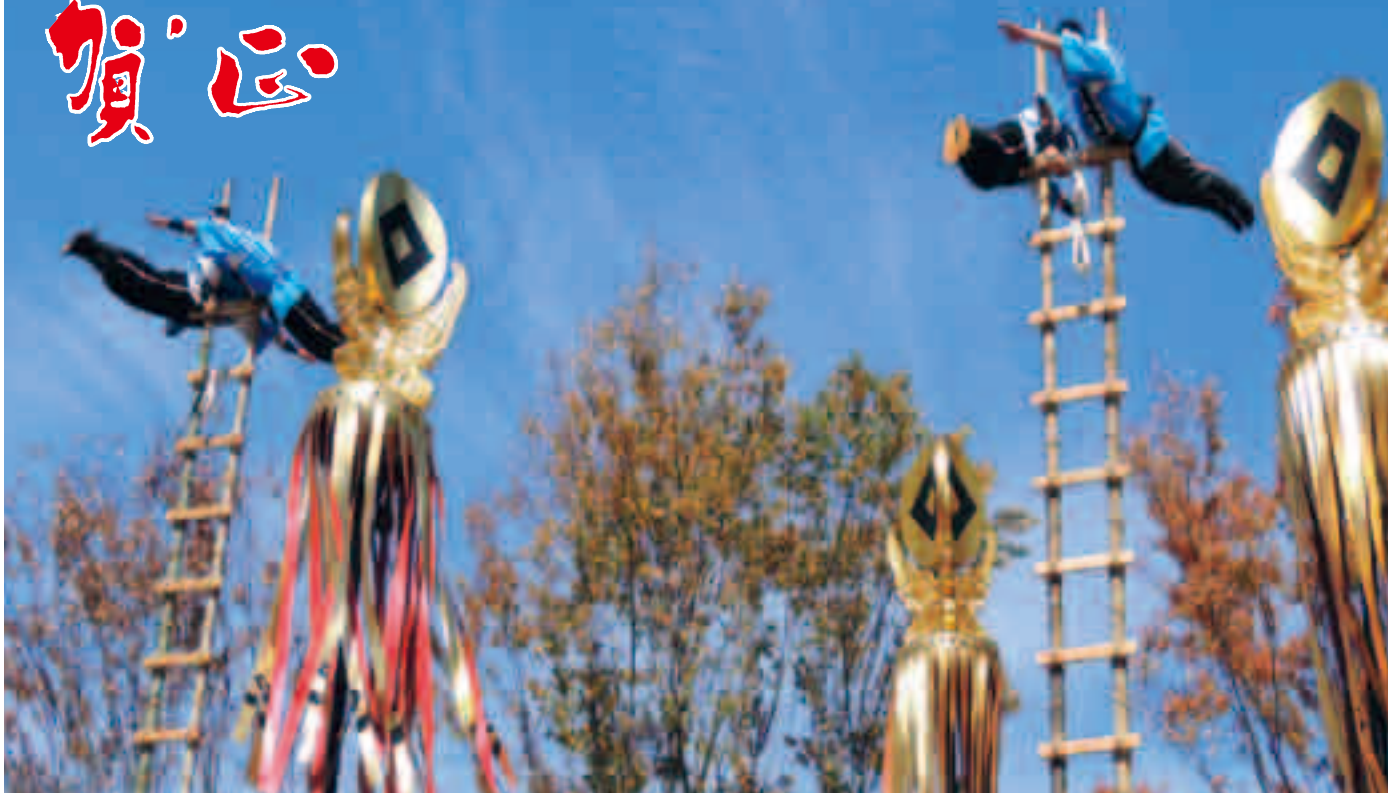
有馬火消のはしご乗り披露 (ふれあい防災フェア)