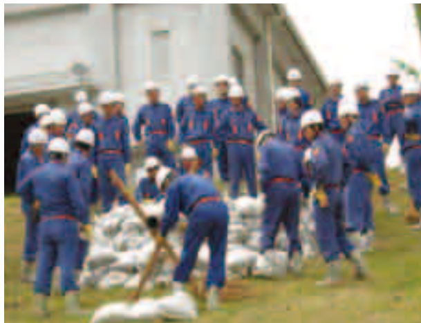
水防訓練時の土のう積み

災害は、いつ起こるか想定できない。しかし災害が起きた場合には、安全を確保しつつ、災害廃棄物を安定して安全に処理することが求められており、施設規模に一定の災害廃棄物を見込むことは不可欠であると考えている。施設規模に一定量を見込むことについては、理解をいただいていると認識している。