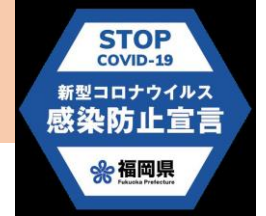
県感染防止ステッカー