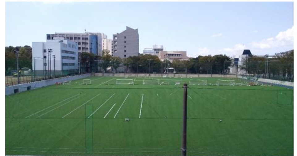
グラウンド内に雨水を貯留