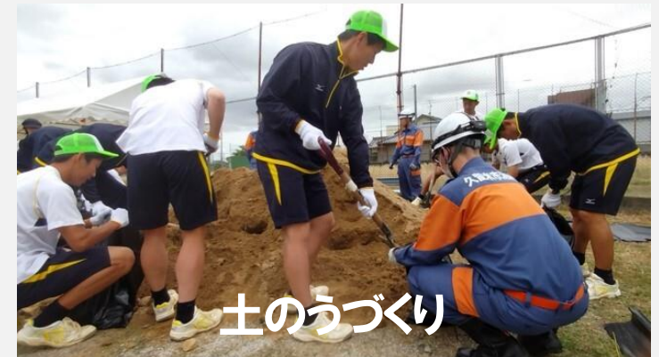
令和7年度の実施状況