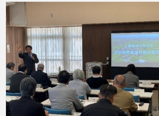
実施状況(令和7年度)