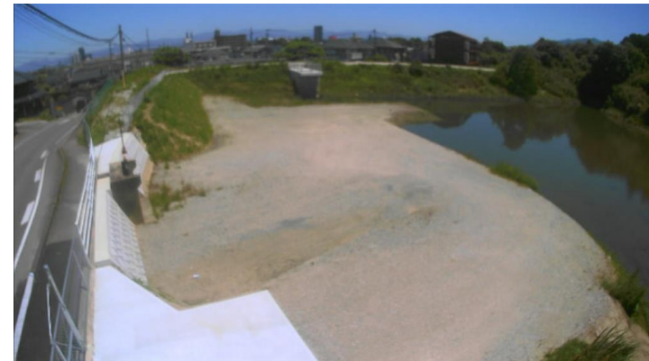
下弓削川流域（旗崎池調整池）