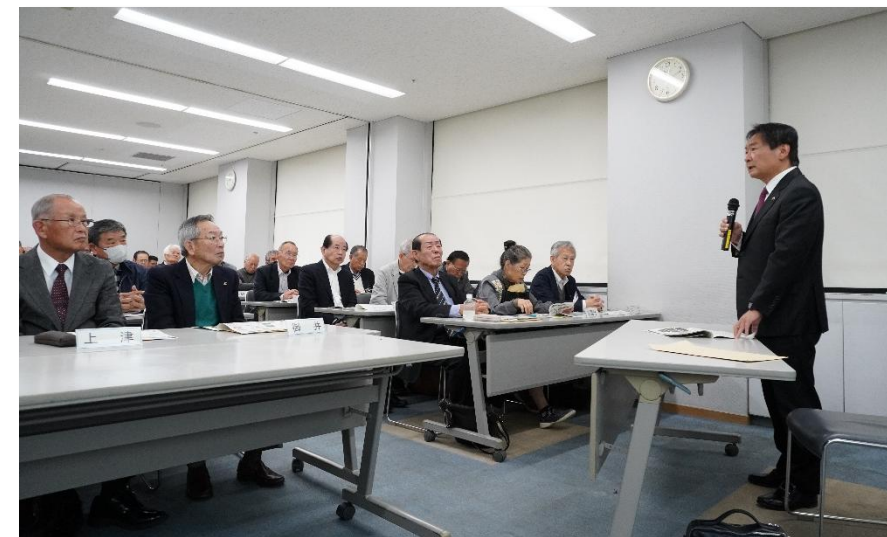
校区まちづくり連絡協議会会合で備えを呼びかけ