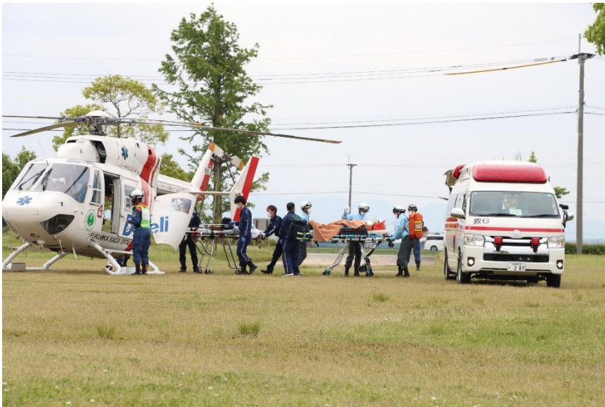
令和7年度訓練の様子