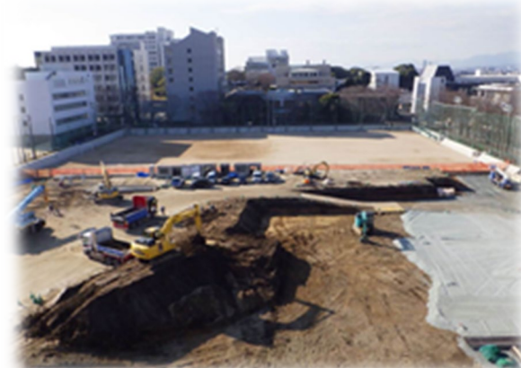
久留米大学貯留施設施工状況