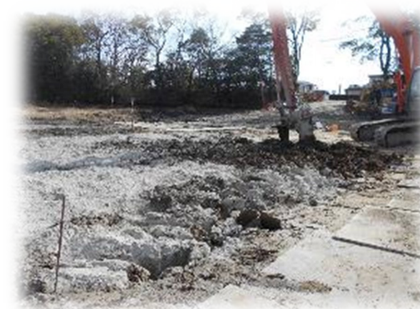
ため池浚渫の状況