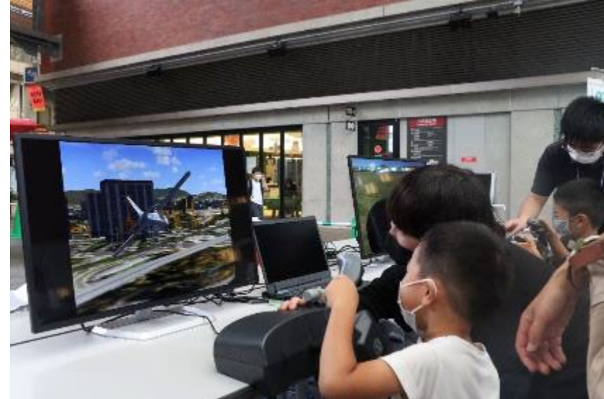
令和4年開催の「ISTSキックオフイベント」の様子