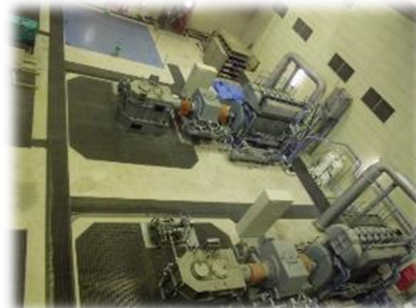
篠山排水ポンプ増設箇所