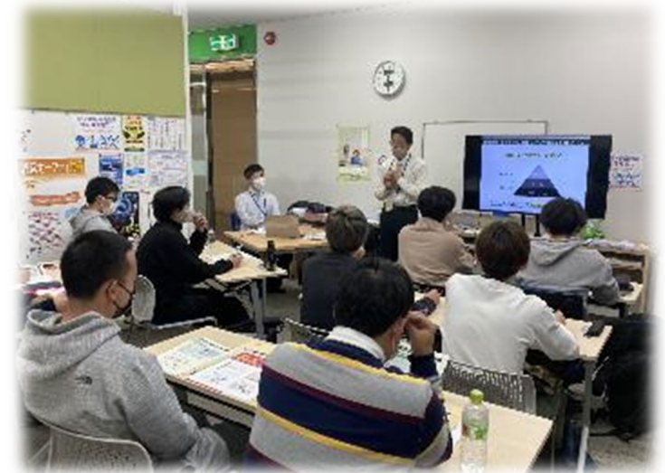
新規創業者セミナーの様子