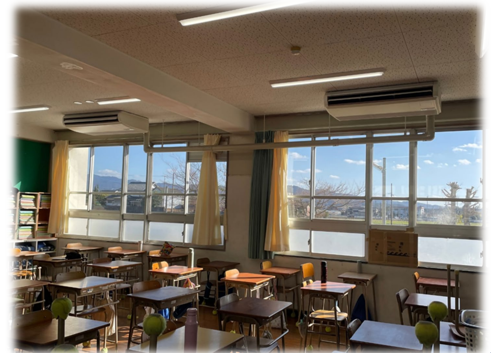
普通教室設置の空調機