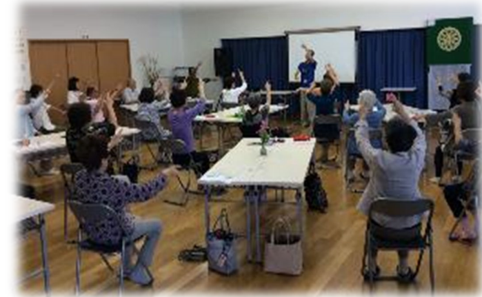
認知症カフェの様子