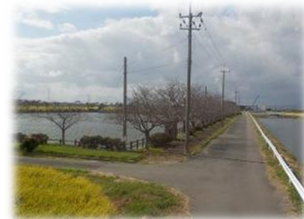
貯水堀のイメージ