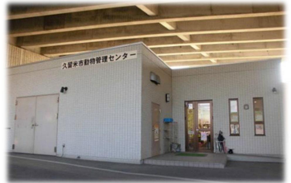
現在の久留米市動物管理センター