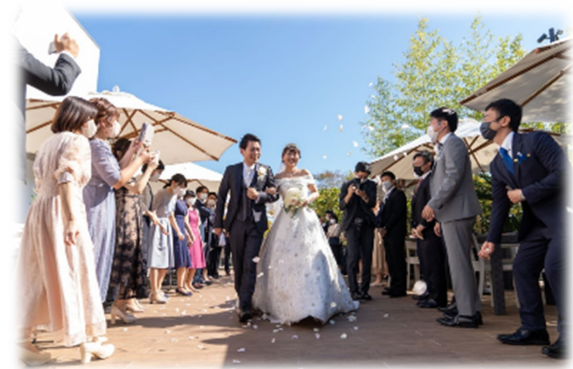
参加者に祝福される新郎新婦