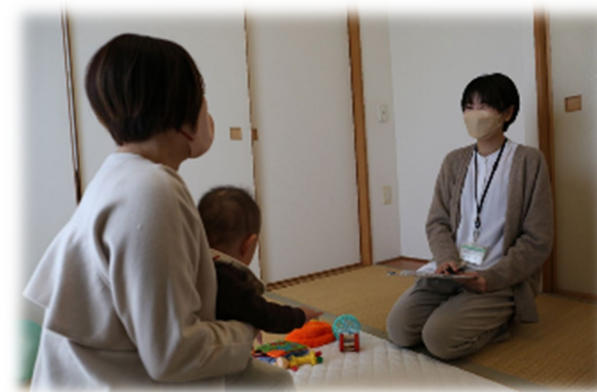
保健師の面談の様子