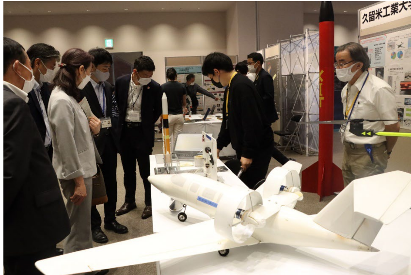
令和4年開催の「ISTSキックオフイベント」の様子