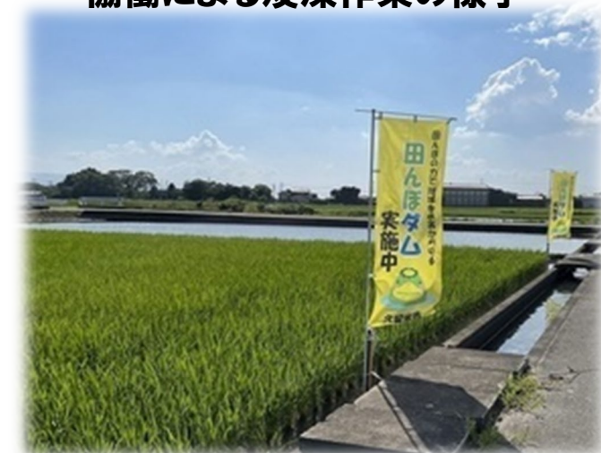
田んぼダムの取り組み状況