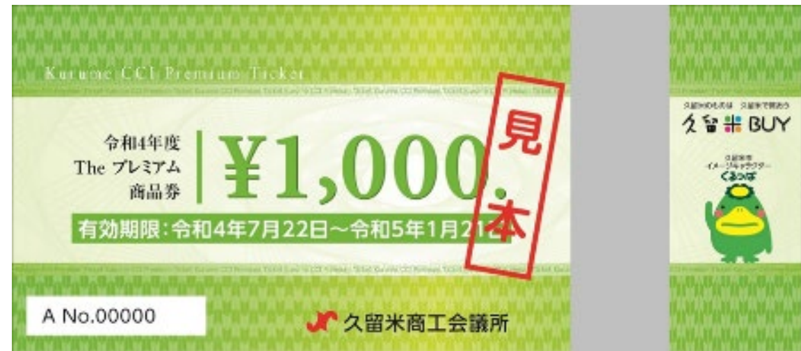
令和4年度発行プレミアム商品券の見本