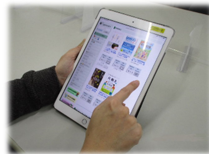
電子書籍のイメージ