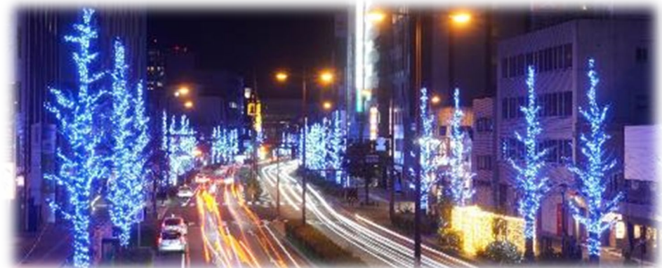
R4くるめ光の祭典の様子