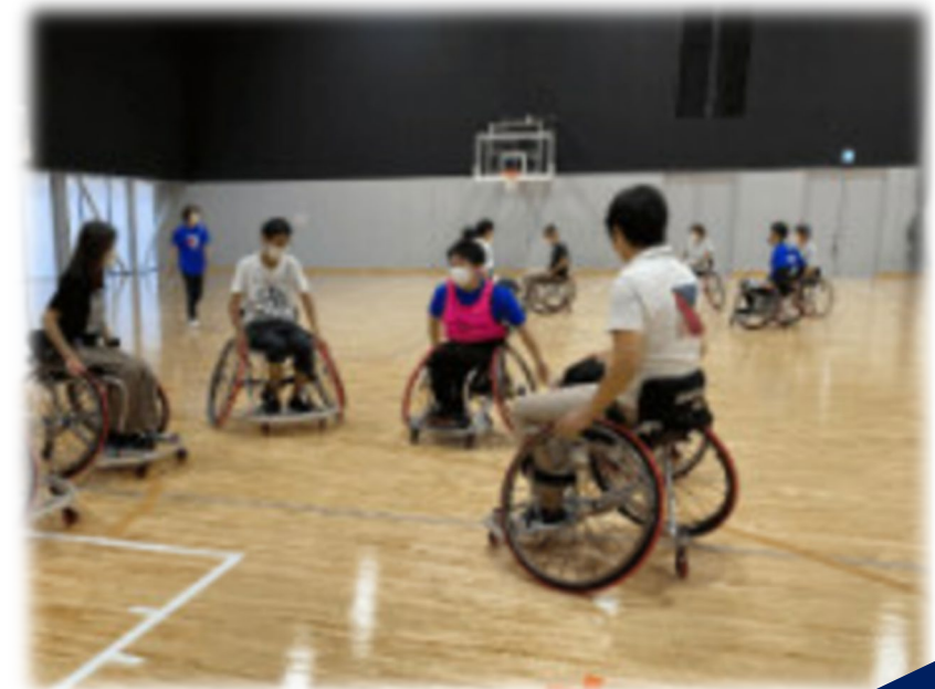
車椅子バスケット体験会

新 障害者スポーツの普及促進 622千円 ・障害者スポーツに関する教室や体験会の開催