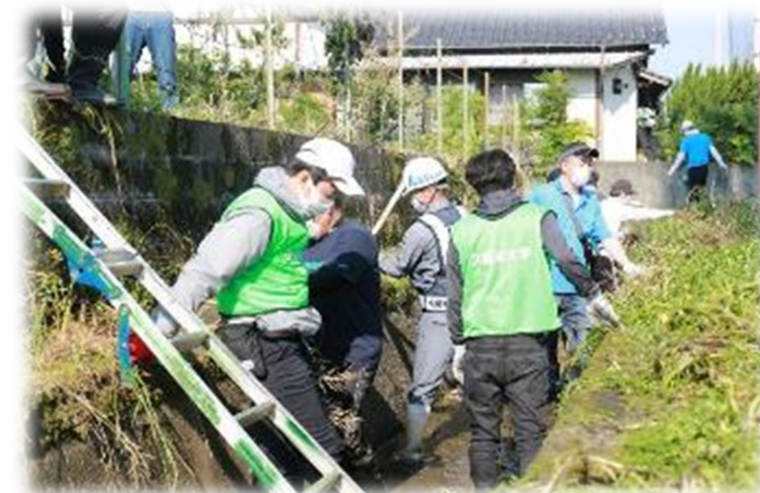
協働による浚渫作業の様子