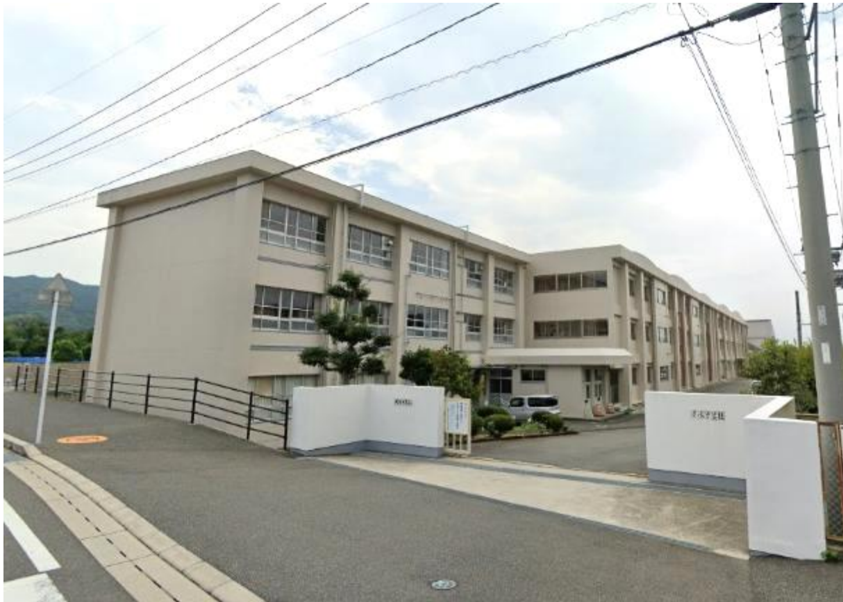
現在の屏水中中学校