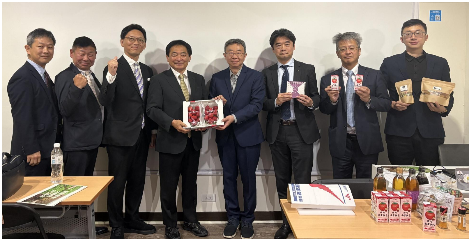
(写真 台湾の方々と記念撮影)

久留米産農産物や日本酒等の食および観光のPRのために台湾を訪れました。久留米の魅力をPRする大変貴重な機会になりました。当市の知名度が向上し観光客が増えることを期待します。