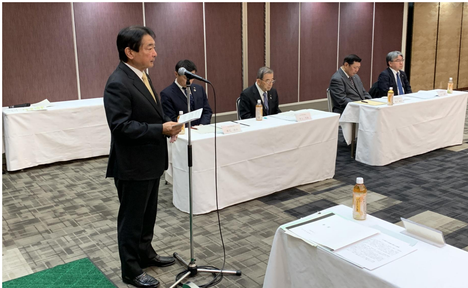
(写真 期成会の様子)

山ノ井川治水促進期成会、大刀洗川・陣屋川改修促進期成会の合同で福岡県に対して要望活動を行いました。豪雨災害への対策を、国・県と連携して進めてまいります。