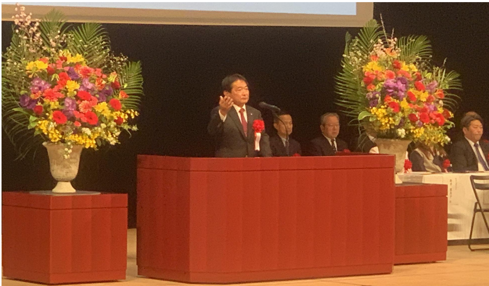
(写真 記念式典の様子)

金丸小学校の創立100周年記念式典に出席しました。金丸小学校が100年の輝かしい伝統と歴史を継承し、今後さらなる飛躍を祈念いたします。