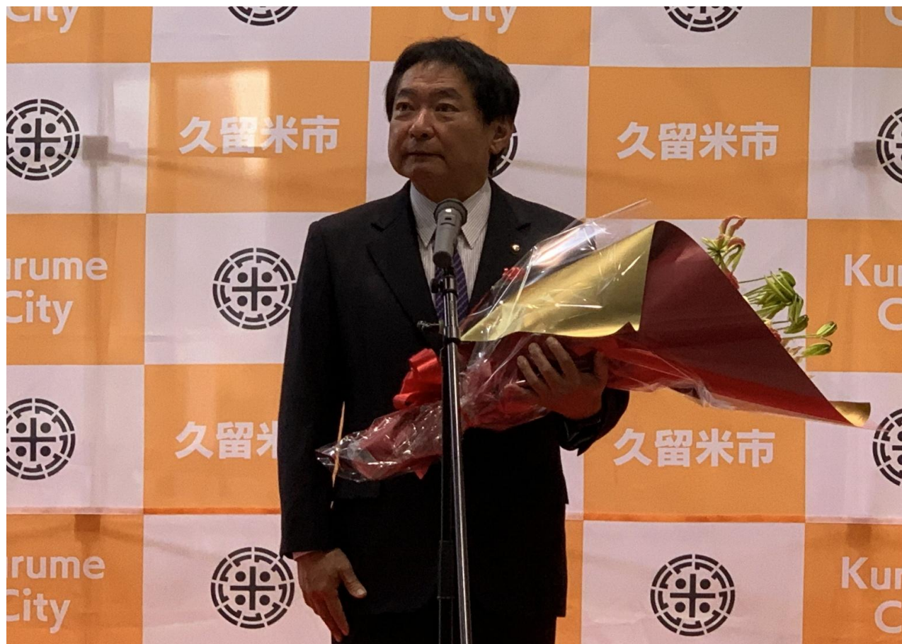
(写真 セレモニー、記者会見の様子)

市長就任2期目として初登庁しました。若い人も安心して働き暮らせる、次世代に誇れるまちを目指し、政策を進めてまいります。