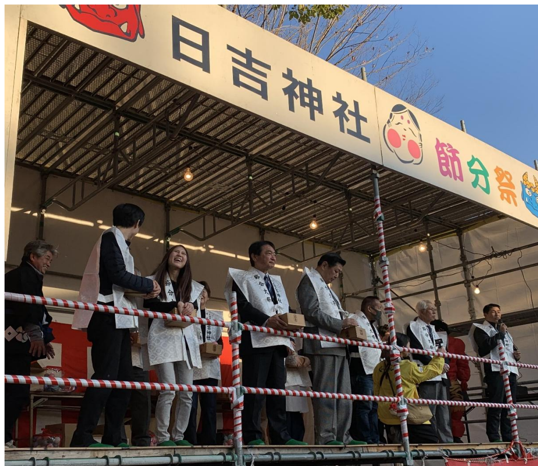
(写真 節分祭の様子)

久留米宗社日吉神社で恒例の節分大祭で「福豆まき」が行われました。毎年節分の日が開催されており、多くの人で賑わいました。