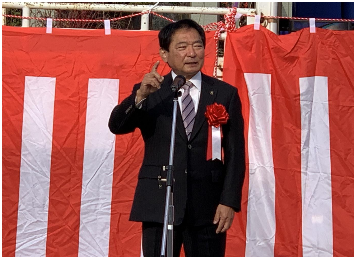
(写真 久留米植木まつりでの挨拶の様子)

第21回久留米植木まつり開会式に出席しました。久留米市は植木・苗木発祥の地と言われ、日本三大植木産地のひとつです。会場の百年公園には、久留米市の植木苗木業者が一堂に会し、1,000種類10万本の展示即売が行われました。