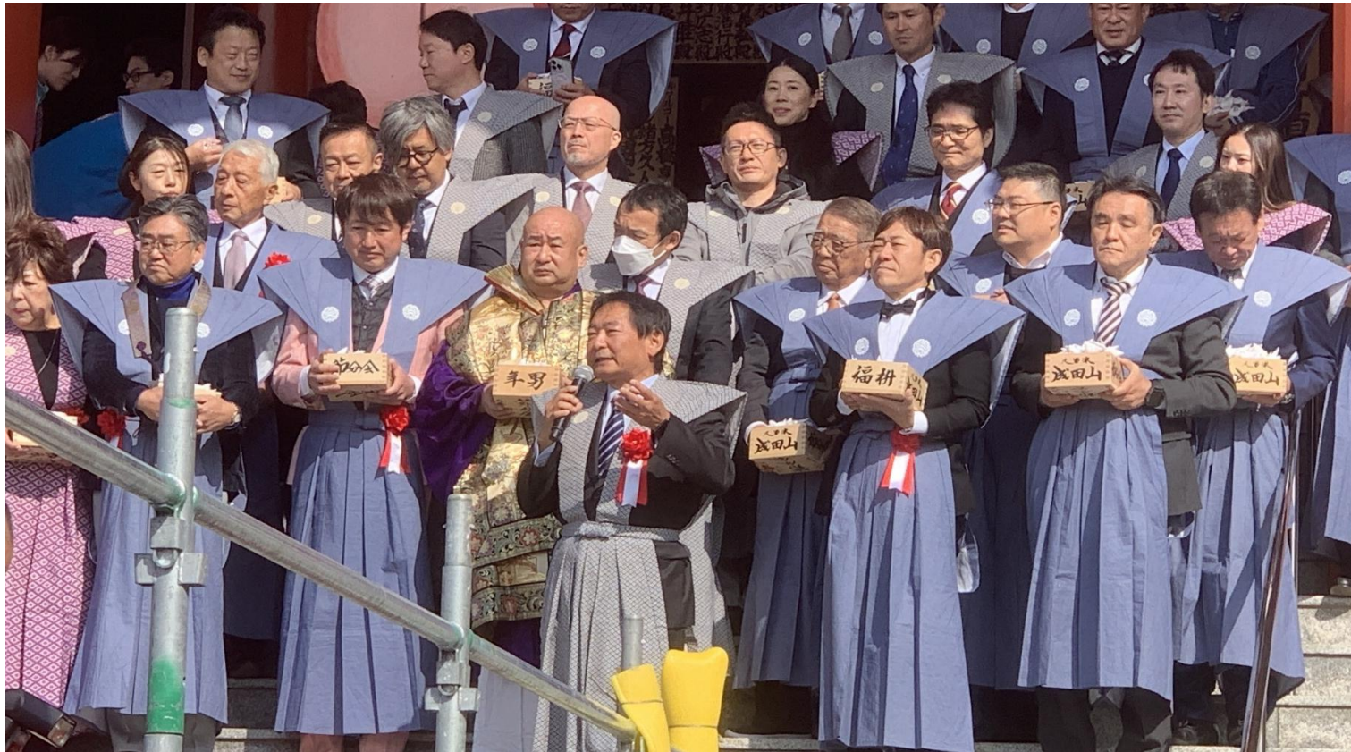
(写真 福豆まき式の様子)

成田山の「節分祭星祭り追儺大護摩供」福豆まき式が行われました。一年の厄を払い、多幸を願うため、毎年2月の第1日曜に開催されています。1年の「福」を掴むために多くの参拝客が訪れました。