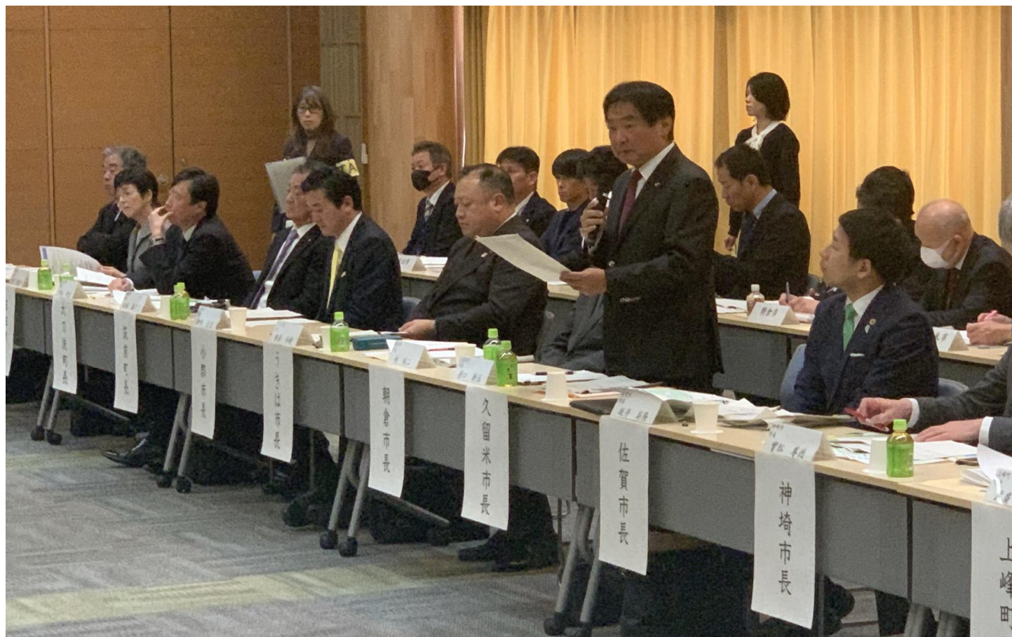
(写真 懇談会の様子)

筑後川流域水懇談会に出席し、筑後川流域の課題や将来に向けた方策等について意見交換を行いました。