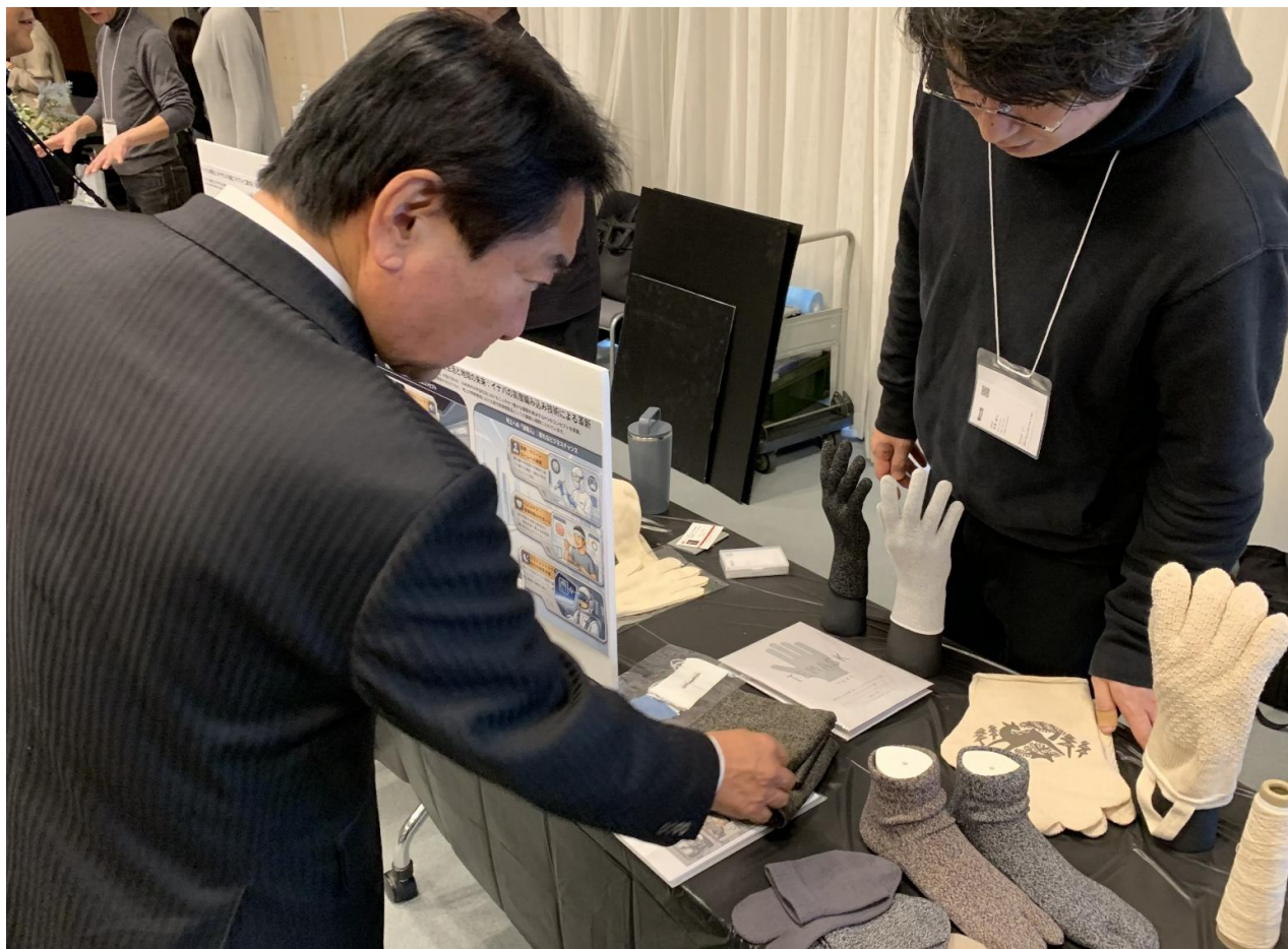
(写真 参加企業ブースを見学する様子)

「福岡スペースリビングフロンティアミートアップ」に出席しました。久留米市としても、宇宙ビジネスに参入する企業を後押ししていきたいと思います。