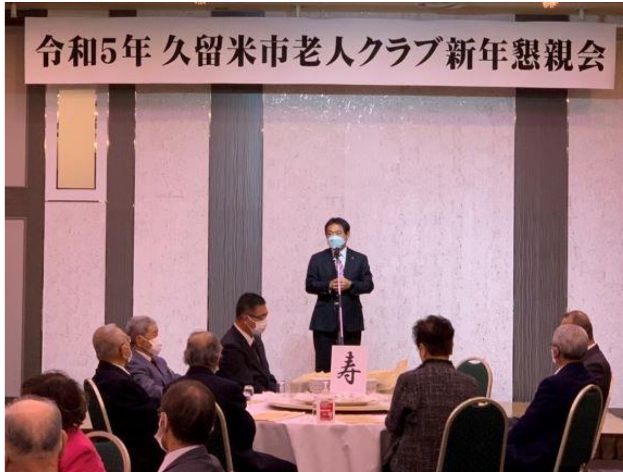
(写真 老人クラブ新年懇親会の様子)

久留米市老人クラブ連合会新年懇親会に出席しました。老人クラブ連合会の皆様には日々の取り組みを身近なところから広げていただき、地域でともに活動する仲間を増やし、本市の老人クラブ活動をさらに発展していただくことを期待致します。