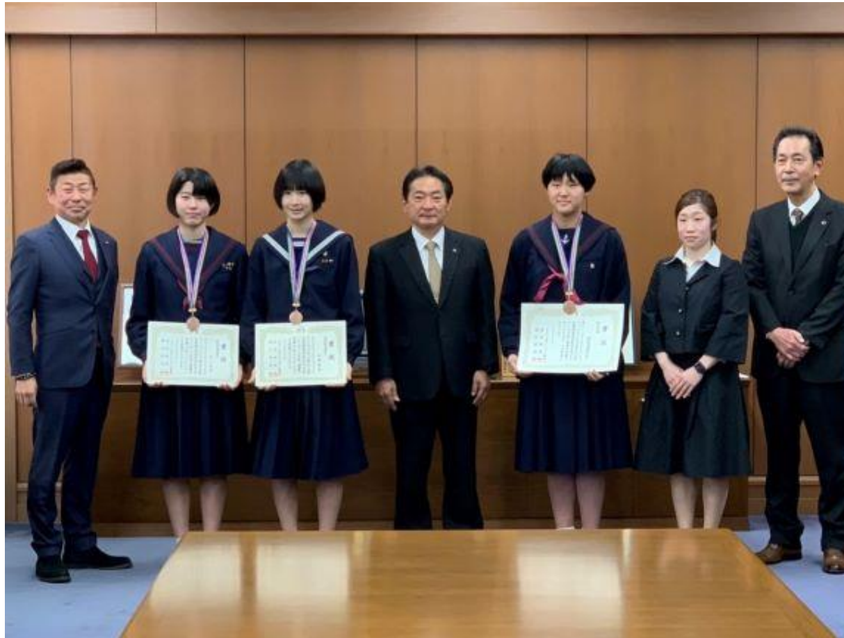
(写真 中学女子バレーボール福岡県選抜の皆様と記念撮影)

中学女子バレーボールの福岡県代表に選出された久留米市在住の3名がお越しになり、JOCジュニアオリンピックカップ 第36回全国都道府県対抗中学バレーボール大会で第3位に入賞されたことを報告して頂きました。全国の舞台で活躍されたことは、本市のスポーツ振興に大きく寄与するものです。