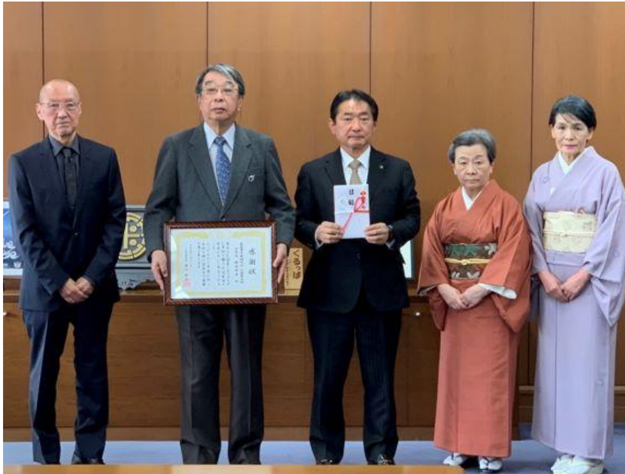
(写真 茶道裏千家淡交会久留米支部様からの寄附贈呈の様子)

茶道裏千家淡交会久留米支部様より現金10万円を寄附いただきました。昭和58年からご寄附を継続していただいております。総額は1千万円を超えます。久留米シティプラザのために有意義に活用させていただきます。