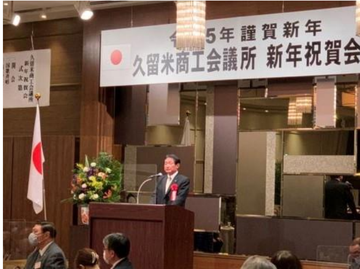
(写真 久留米商工会議所新年祝賀会で挨拶する様子)

久留米商工会議所 新年祝賀会に出席しました。今後とも、地場企業の経営支援にしっかりと取り組まれるとともに、中心市街地活性化や観光振興など、地域経済の発展に大きく貢献いただくことを期待します。