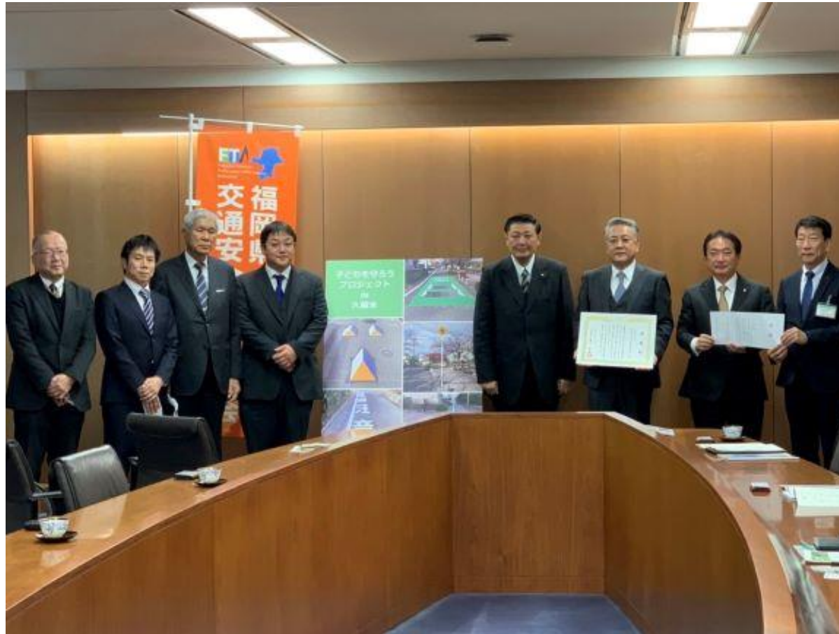
(写真 一般社団法人交通安全施設業協会様からの寄附贈呈の様子)

交通安全施設業協会様より「子どもを守ろうプロジェクト」の一環として、交通安全道路標識と路面標示300万円相当を寄附していただきました。この取り組みは筑後地区において初めてのことです。久留米市を選んでいただいたことに深く感謝申し上げます。