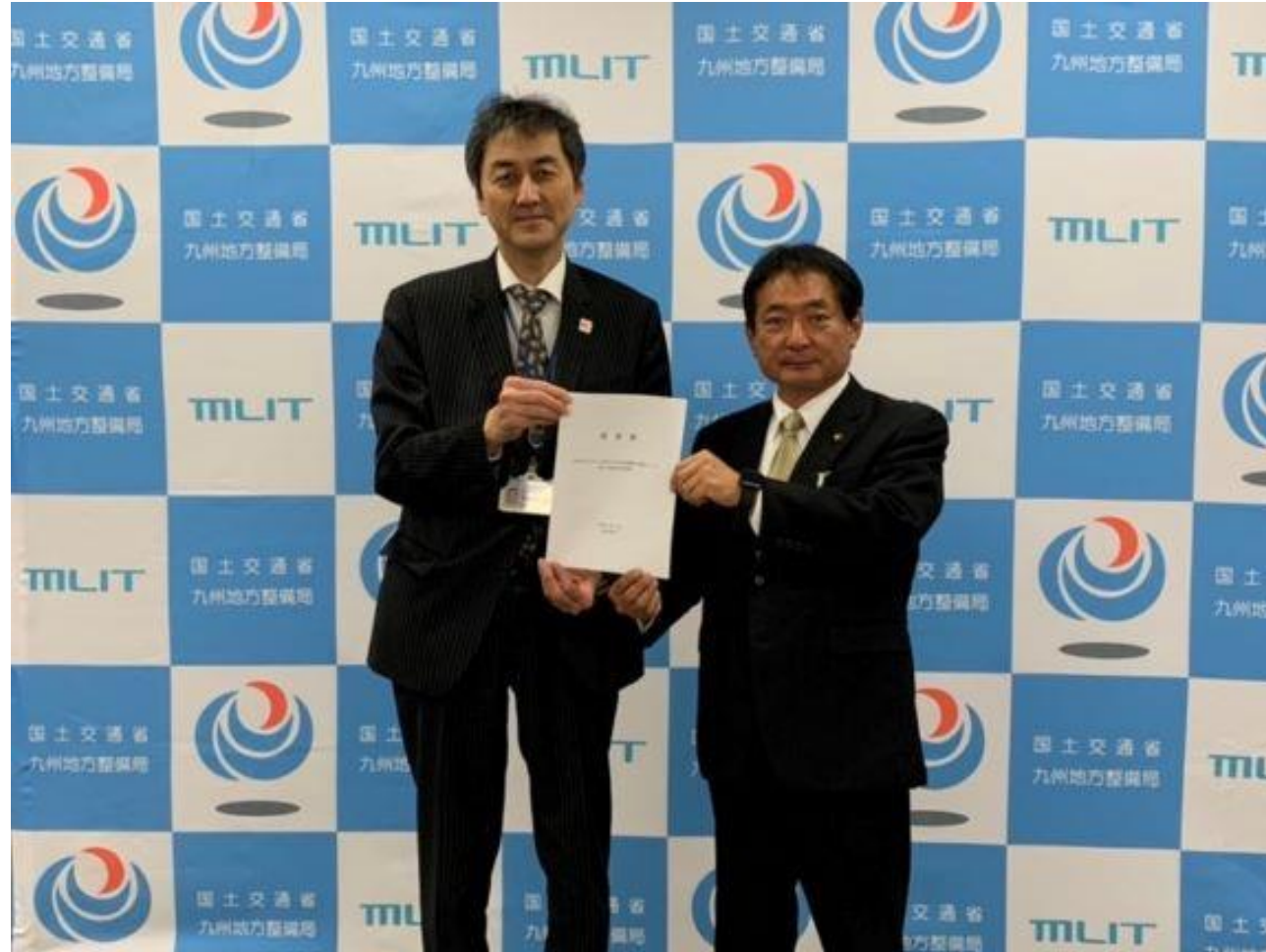
(写真 九州地方整備局へ要望書を提出する様子)

九州地方整備局を訪問し、防災・減災、国土強靱化のための予算確保や災害発生時のポンプ車の派遣等について要望書を提出しました。