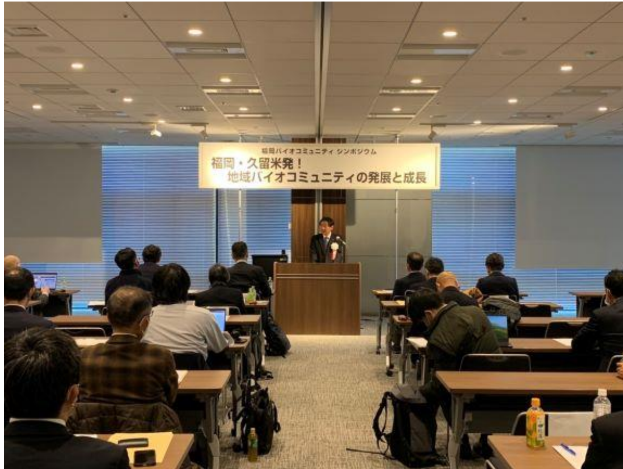
(写真 福岡バイオコミュニティシンポジウムの様子)

東京都中央区にて「福岡バイオコミュニティ シンポジウム 福岡・久留米発！地域バイオコミュニティの発展と成長」を開催しました。これからも久留米市が国内有数のバイオ産業拠点として成長・発展し、世界に羽ばたく企業を輩出できるよう支援に努めて参ります。