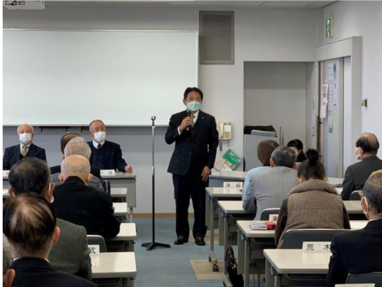
(写真 校区まちづくり連絡協議会理事会の様子)

久留米市校区まちづくり連絡協議会理事会に出席しました。本市の協働において最大のパートナーである各校区振興会の皆様の積極的な活動に心より感謝申し上げます。