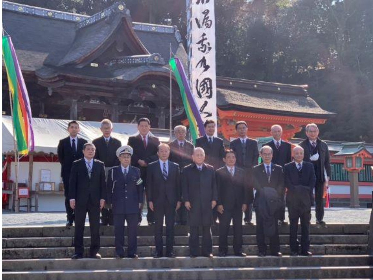
(写真 年頭交通安全祈願で記念撮影)

久留米市交通安全協会様の「令和5年年頭交通安全祈願」に参加しました。セーフコミュニティの取り組みの一つでもある交通事故防止が進むことを願っています。