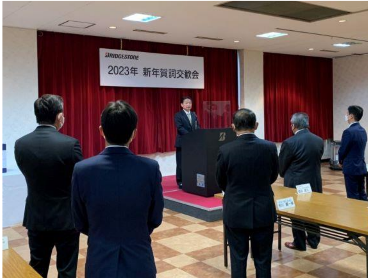
(写真 ブリヂストン久留米工場新年賀詞交歓会の様子)

株式会社ブリヂストン久留米工場 新年賀詞交歓会に出席しました。同社は、創業以来、本市の地場産業の成長、雇用の創出に大きく寄与され、本市の発展に多大なる貢献をいただいていることに深く感謝致します。