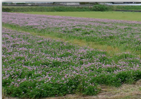
<緑肥の施用の取組（レンゲの作付け）>