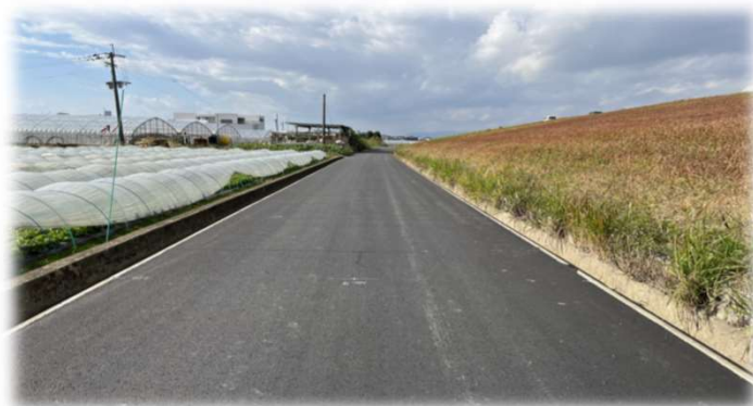
<荷痛み防止のために行った農道舗装>