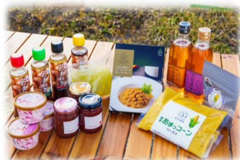
<市が支援して開発された6次産業化商品>