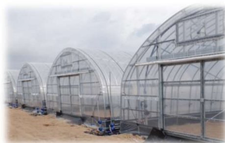
<補助事業で取得したハウス>