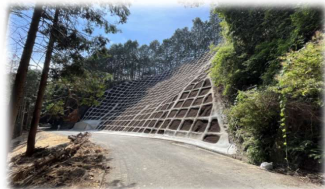
<がけ崩れ防止のために行った法枠工>