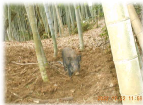
<イノシシの掘り起し被害の状況>