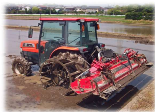
<補助事業で取得したトラクター>