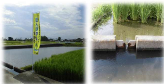
<田んぼダム実施状況>