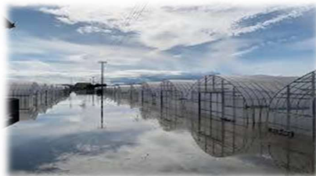
<大雨により浸水した農業用施設>