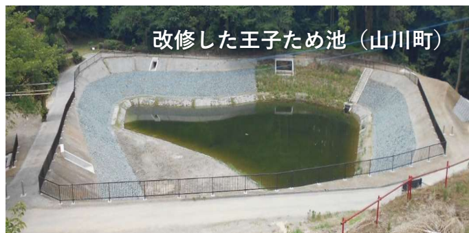
〈ため池改修後の様子〉