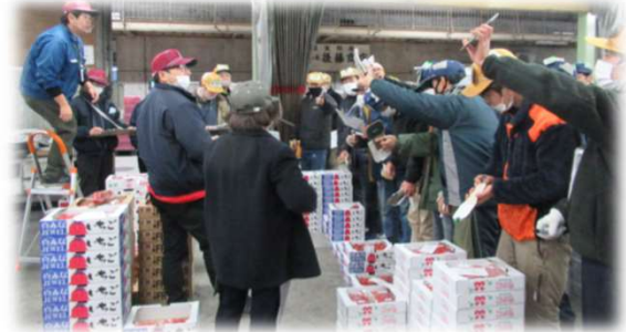
<中央卸売市場での青果部せりの様子>