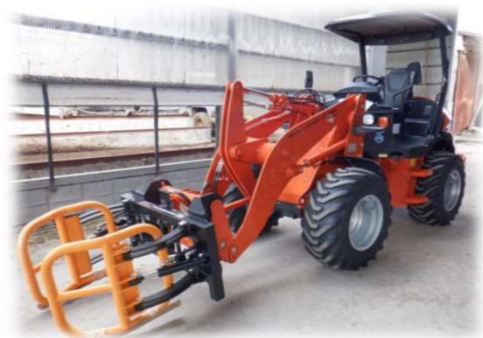
<補助事業で取得したホイールローダー>