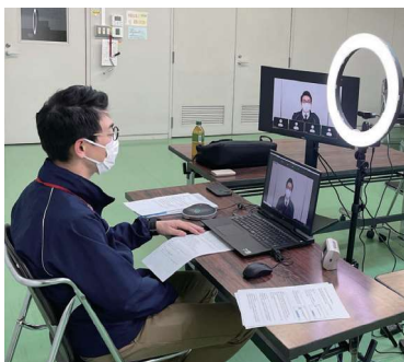
オンラインによる合同会社説明会