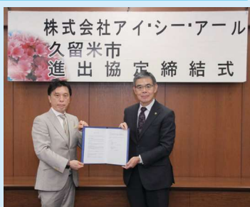
九州地区の中心拠点を開設へ