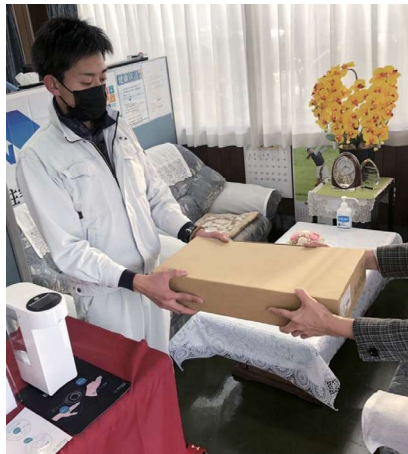
宅配便の職場受け取りは、働きやすさ向上(福利厚生)にもつながります

子どもたちの未来に、クリーンな地球環境を残すため、省エネ・創エネ住宅を供給するとともに、社内でもクールビズをはじめ、ウォームビズ、エコドライブなど社員が取り組みやすいエコ活動を行っています。