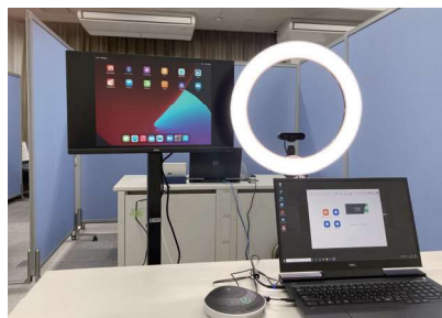
オンライン面接用機器