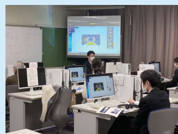
高速回線を利用し、ICT活用講座を開催(職業訓練センター)