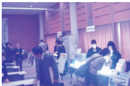
市内の環境関連企業10社がブース出展しました

1月20日(金)、久留米ビジネスプラザにおいて、「くるめECOビジネスセミナー」を開催しました。セミナーでは、「我が国の環境ビジネスの現状と将来」と題した基調講演を始め、久留米市内の環境活動に熱心な企業による事例紹介、発表者と来場者の皆さんが情報交換できる展示・相談コーナーが設けられました。