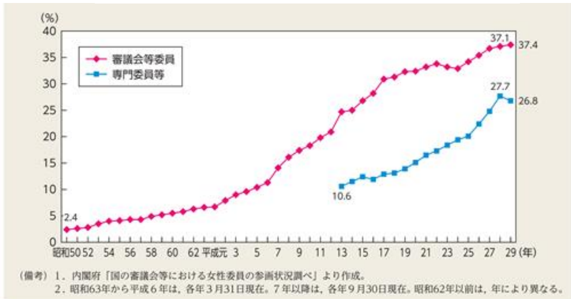
図V-4 審議会等における女性委員割合の推移(国)

*平成28年度に「久留米市における審議会等への女性の登用促進要綱」を見直し、「各審議会等の委員の割合は男女いずれも40パーセントを下回らないものとする」と、数値目標を設定した。