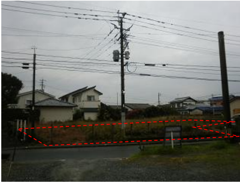
物件東側から西向きに撮影