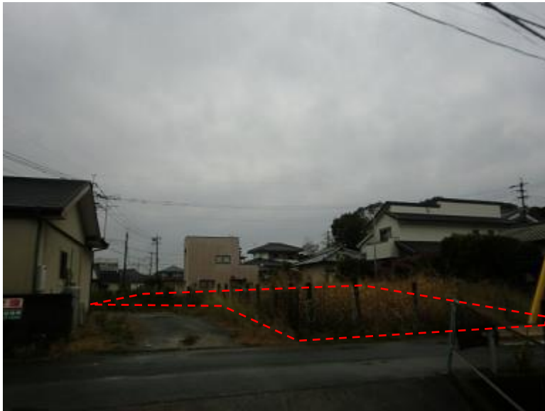
物件北東側から南西向きに撮影