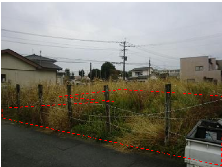
物件北側から南向きに撮影