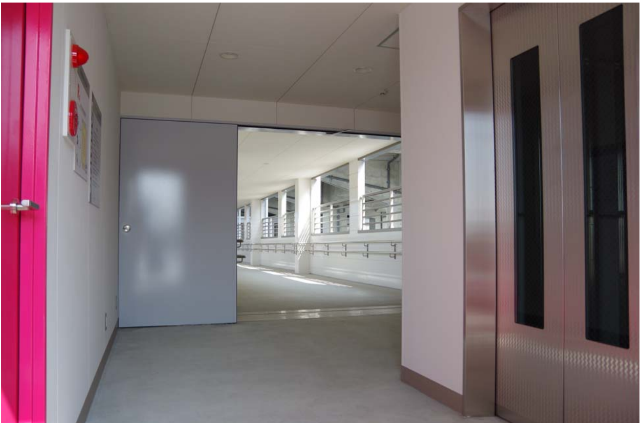
④立体駐車場から上空連絡通路への接続