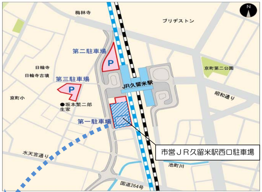
市営JR久留米駅西口駐車場