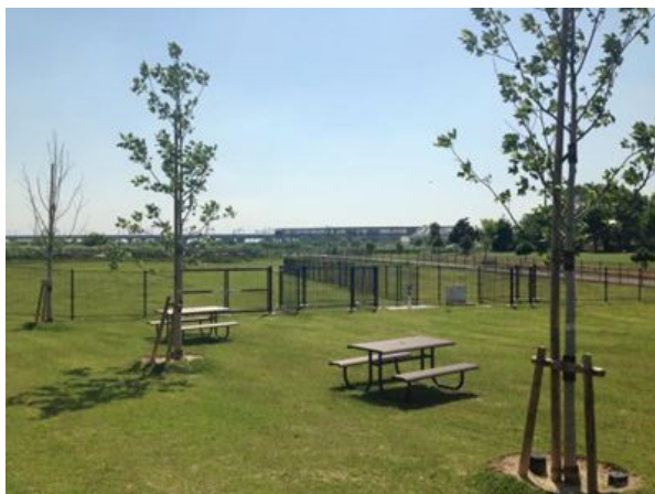
整備イメージ（筑後広域公園事例）