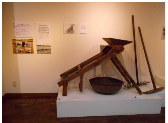
まんごとお お米とゴミを選別する万石通し