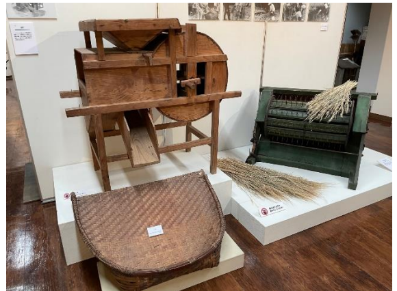
だっこくき 唐箕、足踏み脱穀機など収穫に使う道具