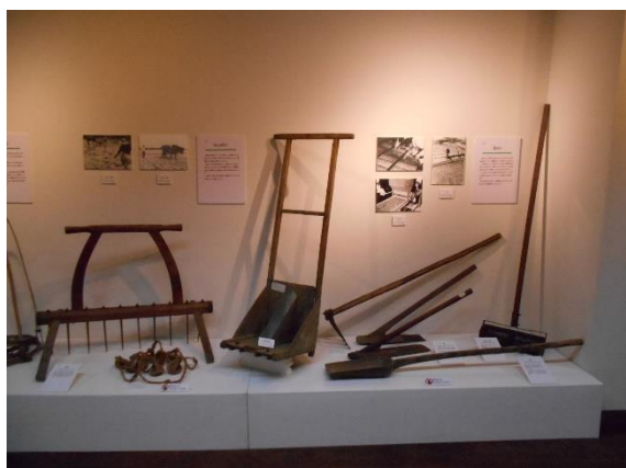
鋤や鍬など耕したり種まきに使う道具