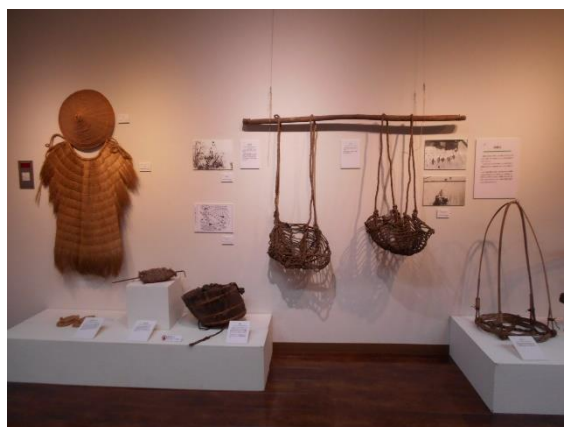
おけ みの かさ モッコや打ち桶、蓑、笠など田植えの道具