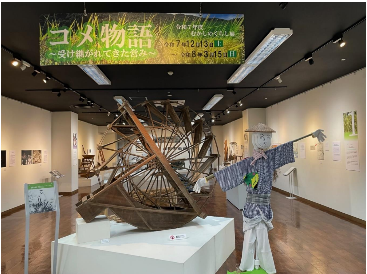
展示会場（正面から）

本展では、そうしたコメの歴史的な位置づけをふまえ、先人たちが工夫を重ねてきたコメ作りの歩みを、資料を通してたどりました。