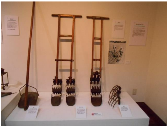
かんづめ 雁爪など田の草取りに使う道具

これらの農具は、作業を少しでも楽に、確かな実りに近づけるために工夫されてきたもので、自然と向き合いながらコメを育ててきた先人たちの経験と技が刻まれています。