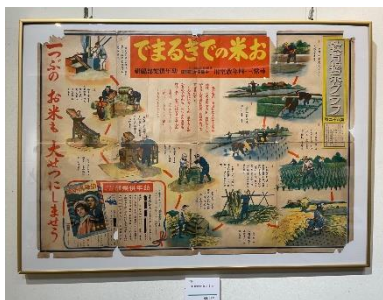
お米のできるまで