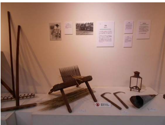
千歯扱き、鎌、油差しなど