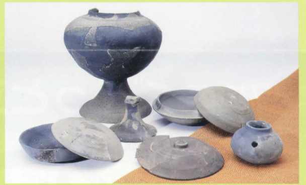
31 内畑古墳から出土した須恵器