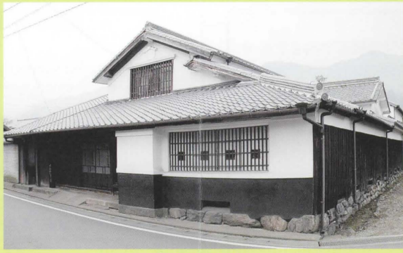
43 鹿毛家住宅(県指定)