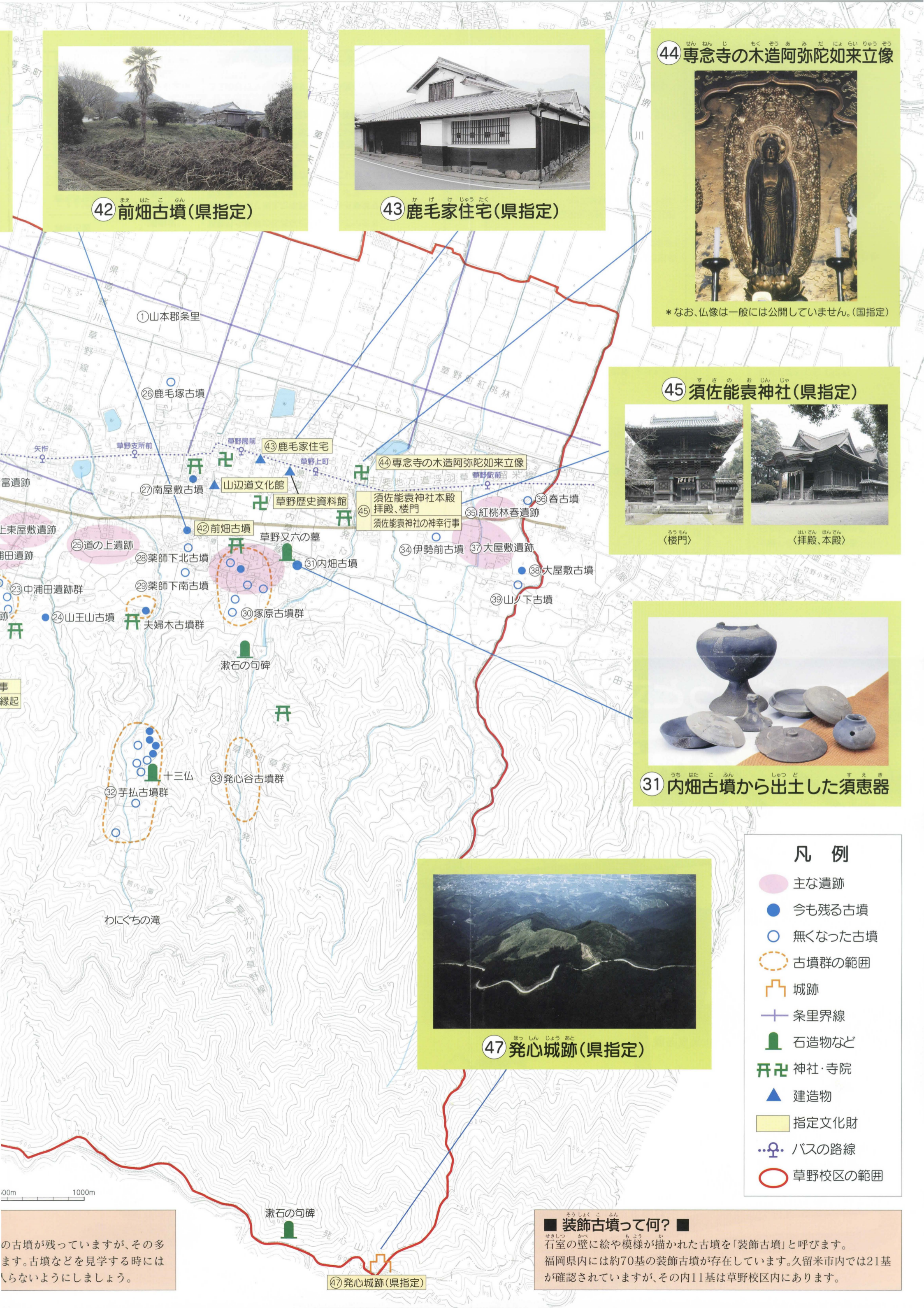
はいでん ほんでん (拝殿、本殿)