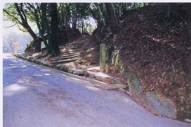
高良大社裏の列石