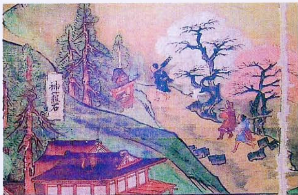
『絹本着色高良大社縁起』(部分)

年に八木樊三郎が他の地域の神籠石を調査し、山城として紹介しました。また明治35(1902)年に喜田貞吉は列石の状況を見て山城説を否定し、神域であると発表し、学界において山城説と神域説の神籠石論争が始まりました。昭和37年(1962)に佐賀県おつぼ山神籠石で始めて発掘調査が実施され、その結果、山城として報告され神籠石論争の終焉を迎えつつありますが、学界においては今だ「神籠石」の名称をなくすまでには至っていません。