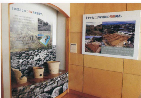
荒木小学校玄関のミニ博物館