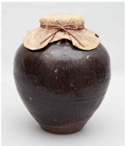
褐袖四耳壺 (呂宋壺) 銘「小烏茶壺」(篠山神社所蔵)

大身之衆ニハ数寄屋有之候。毎年宇治茶を申遣、口切り之茶湯なども有之候。小身之面々も宇治より茶を取寄、其時分ハ小身者も煎茶ハ無之候。在町も挽茶を用申候。