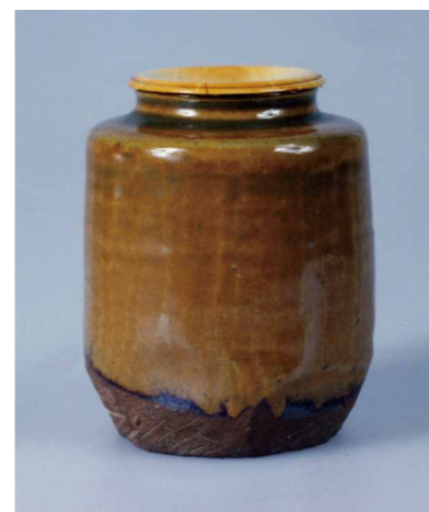
柳原焼 黄釉肩衝茶入 (久留米市教育委員会所蔵)

は、茶道においては自ら茶碗や水指などの茶陶器を作るほど熱中しました。それらは 柳原焼 と呼ばれ、開窯に際し、表千家 不白流 の3代・川上 宗寿 を招いて、指導を仰いでいます。 柳原焼は、藩の財政難から短い間で廃窯となりますが、様々な地方の茶陶を手本とした作品は、陶工や陶土までこだわりぬかれ、今日でも珍重されています。多くは高台に「柳原」の陽刻・陰刻や、「成」の字を基にした頼徳の花押などがあります。