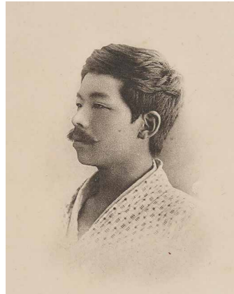
青木繁 『青木繁画集』 (大正2年 政教社刊) より