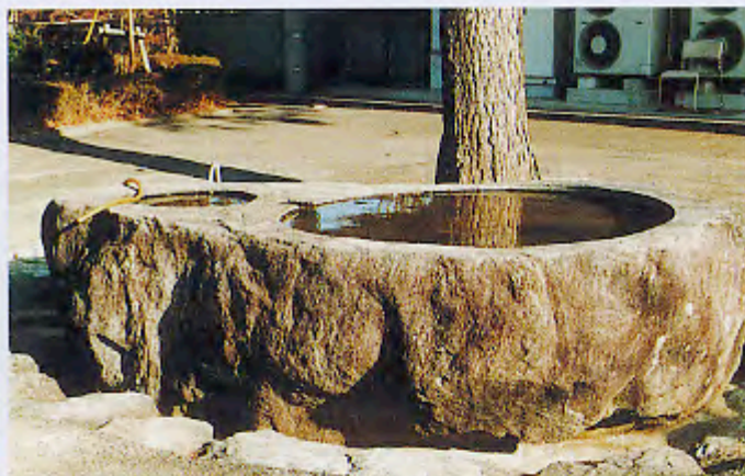
忠霊塔前の広場におかれた手洗鉢