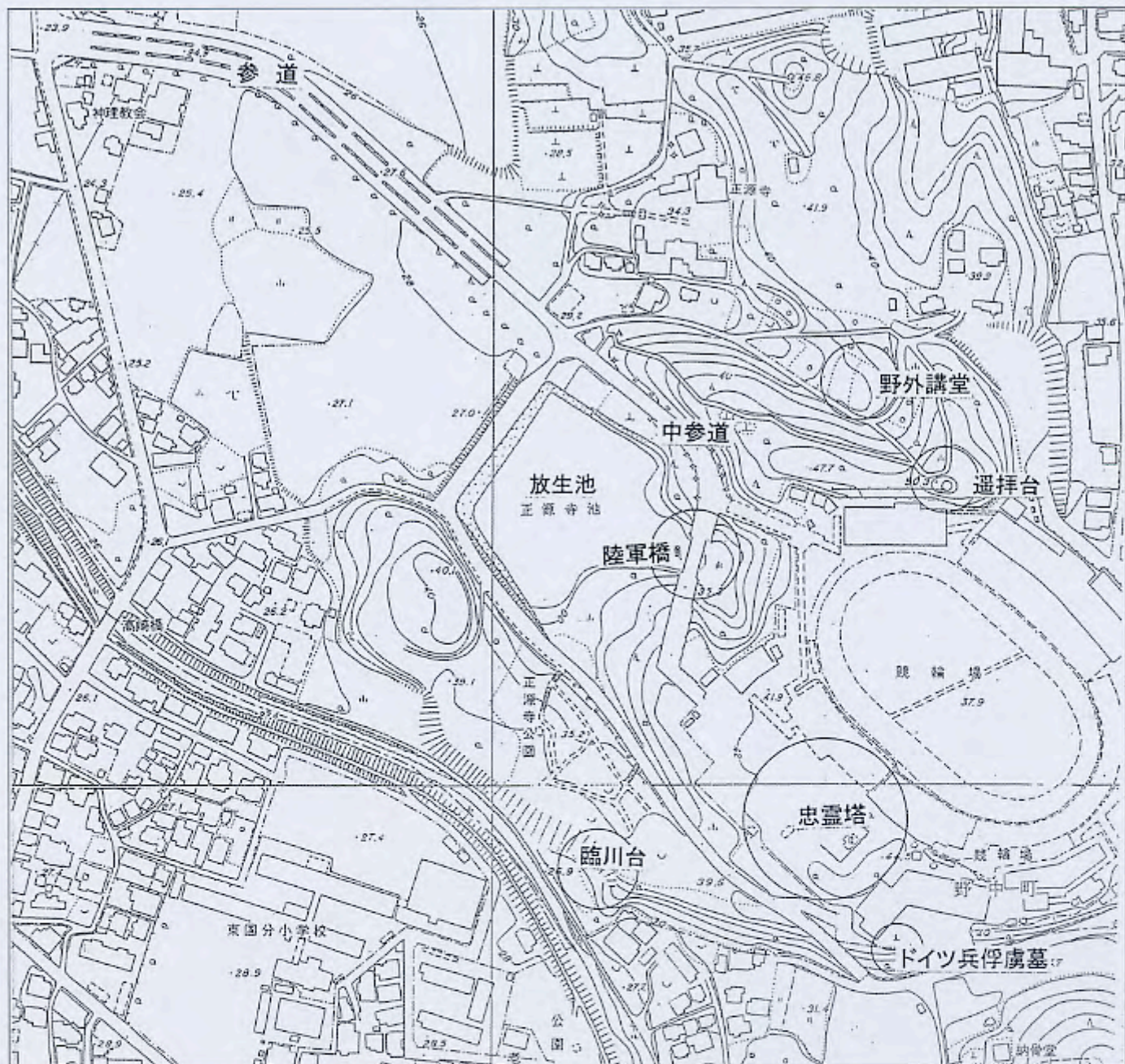
陸軍墓地遺跡配置図