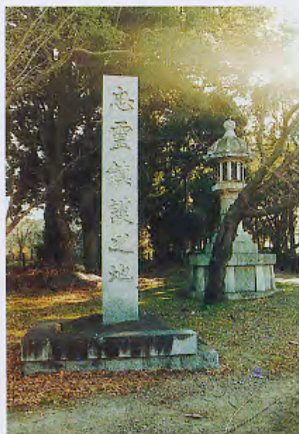
参道入口の忠霊鎮護之地碑

参道 表参道と中参道からなり、参道入口には靖国神社の大灯籠を模した灯籠が置かれています。参道は車道と歩道に分かれ幅28mあります。約275m東進すると歩道がなくなり、中央の幅10mの道だけになります。そこから中参道が湾曲して忠霊塔前の広場まで約200m延び、放生池に架かる陸軍橋もこの参道の一部です。陸軍橋までの参道には春日灯籠が北側21基、南側15基が並びます。この参道には玉砂利が敷かれていたようです。参道の楠木は昭和15年11月に久留米旭屋社員の奉仕で植えられ、同16年7月には久留米郵便局職員が購入した栗・銀杏・山桃などを参道右側に植栽しています。