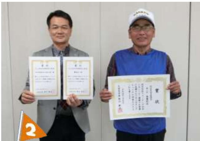
(第2位) 南薫 校区