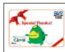
(写真2:クオカード 1000 円分)