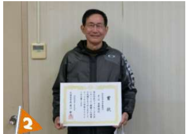
(第2位) 草野 校区