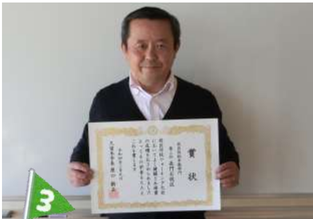
(第3位) 長門石 校区