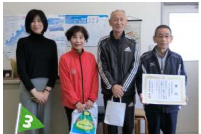
(第3位) 高良内 校区