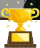
(優勝) 山川 校区