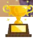
(優勝) 宮ノ陣 校区