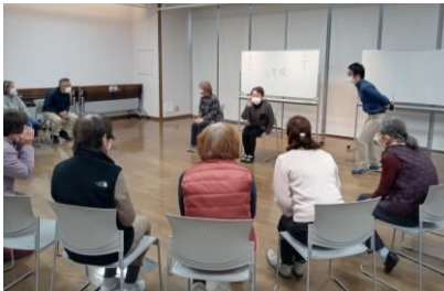
ヒント当てクイズ

コミュニケーションの促進や身体機能の維持を目的とする、ボール遊びなどのスポーツやゲームなどの活動 (例) ペタンク、お手玉での的あてゲームなど