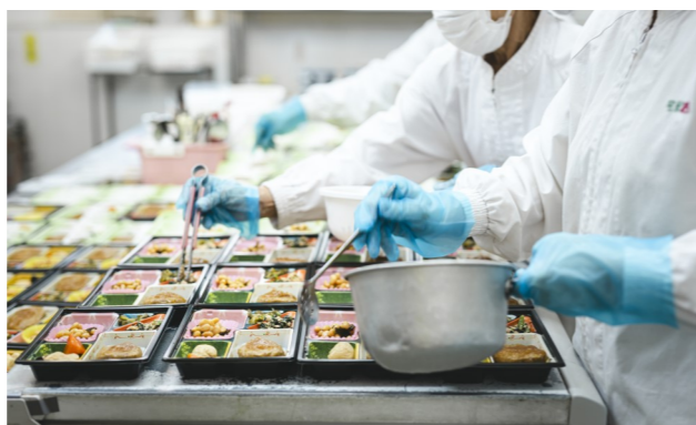
お昼のお弁当を丁寧に盛り付ける調理スタッフの皆さん。3人が手分けして、この日のメインのハンバーグと、煮物や和え物などを手際よく並べていきます