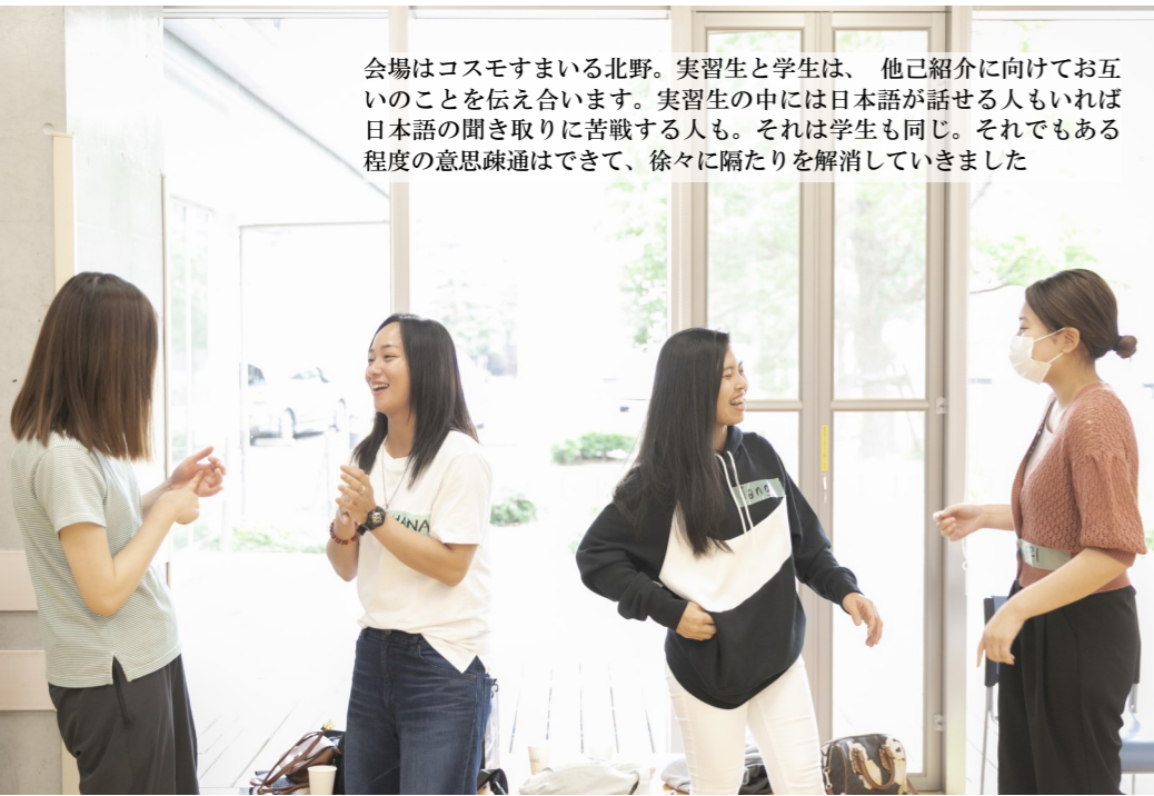
会場はコスモすまいる北野。実習生と学生は、他已紹介に向けてお互いのことを伝え合います。実習生の中には日本語が話せる人もいれば日本語の聞き取りに苦戦する人も。それは学生も同じ。それでもある程度の意思疎通はできて、徐々に隔たりを解消していきました