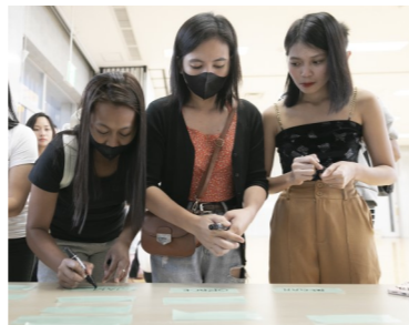
(上)受付でテープに名前を書き、服に貼り付けました。(下)ビートルズの「Let It Be (レットイットビー)」をピアノの伴奏で歌いました