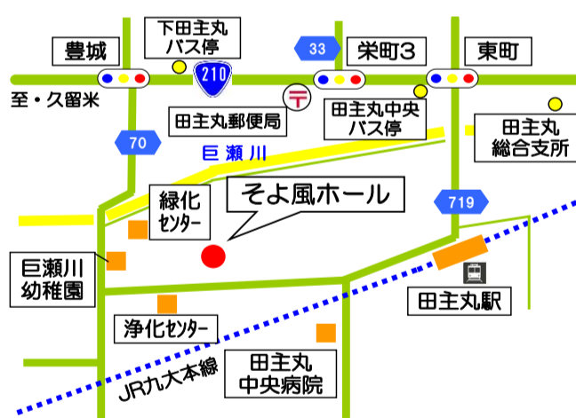
そよ風ホール 多目的研修室 (久留米市田主丸町田主丸770番地1)