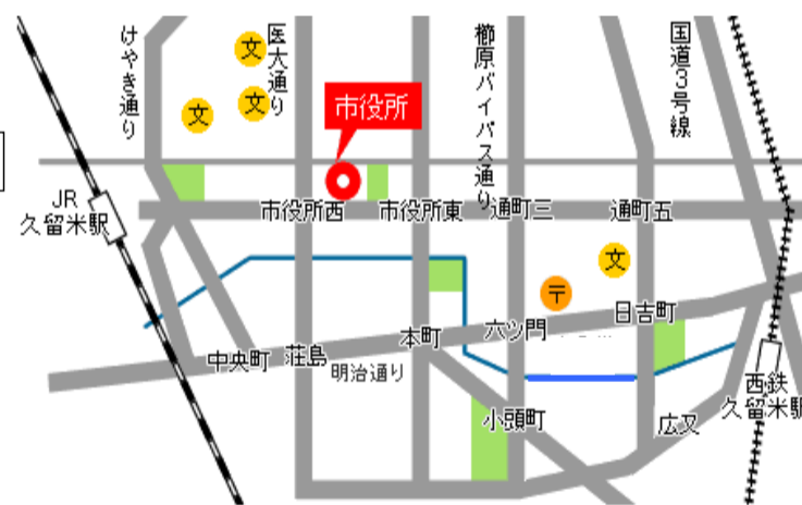
市役所本庁舎 2階くるみホール (久留米市城南町15番地3)