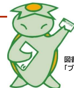
図書館シンボルマーク 「ブックン」